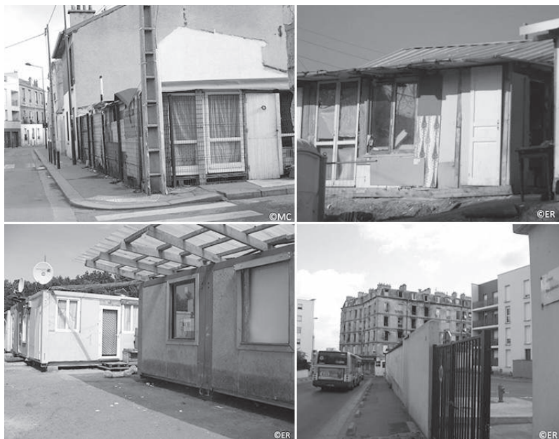
Photographies 1-2-3-4. Les sites de logement.

De haut en bas et de gauche à droite : passage Dupont (1), la Briche (2), site Voltaire (3), résidence Charles Michel (4 – immeuble le plus à droite).