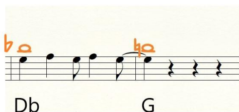
illustration 5 : « Ford Mustang », texture harmonique à demi-ton ascendant sur « et à gauche à droite » (notes en orange).

Enfin, de manière plus discrète, on rencontre au cœur de l'harmonie une autre symétrie : les accords utilisés pour les deux premières mesures nous font entendre un do pour la première mesure, un do bémol pour la seconde, un demi-ton plus bas (illustration 3, notes écrites en orange) 4 . Or la fin de cette phrase mélodique, sous les paroles « et à gauche à droite », nous offre quant à elle un autre demi-ton, ascendant celui-là, en symétrie avec le premier : celui de cet autre accord inattendu sous « et à gauche à », un savoureux « degré napolitain » posé sur son ré bémol, suivi, comme de juste, de la dominante du ton, un accord de sol majeur, intégrant un ré bécarré, sous le dernier mot, « droite » (illustration 5, notes en orange).