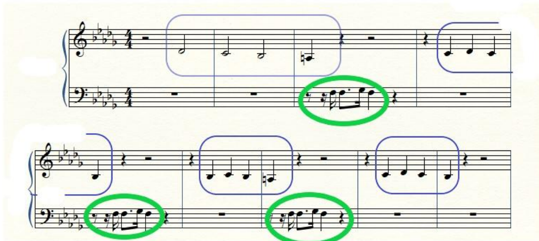
Illustration 1 : « Les p'tits papiers », phrase mélodique, 1 ère partie.

Pour prendre un premier exemple de chanson duelle, je partirai des « P'tits papiers », entièrement construite à deux niveaux. Tout d'abord, sur le plan mélodique (illustration 1) :