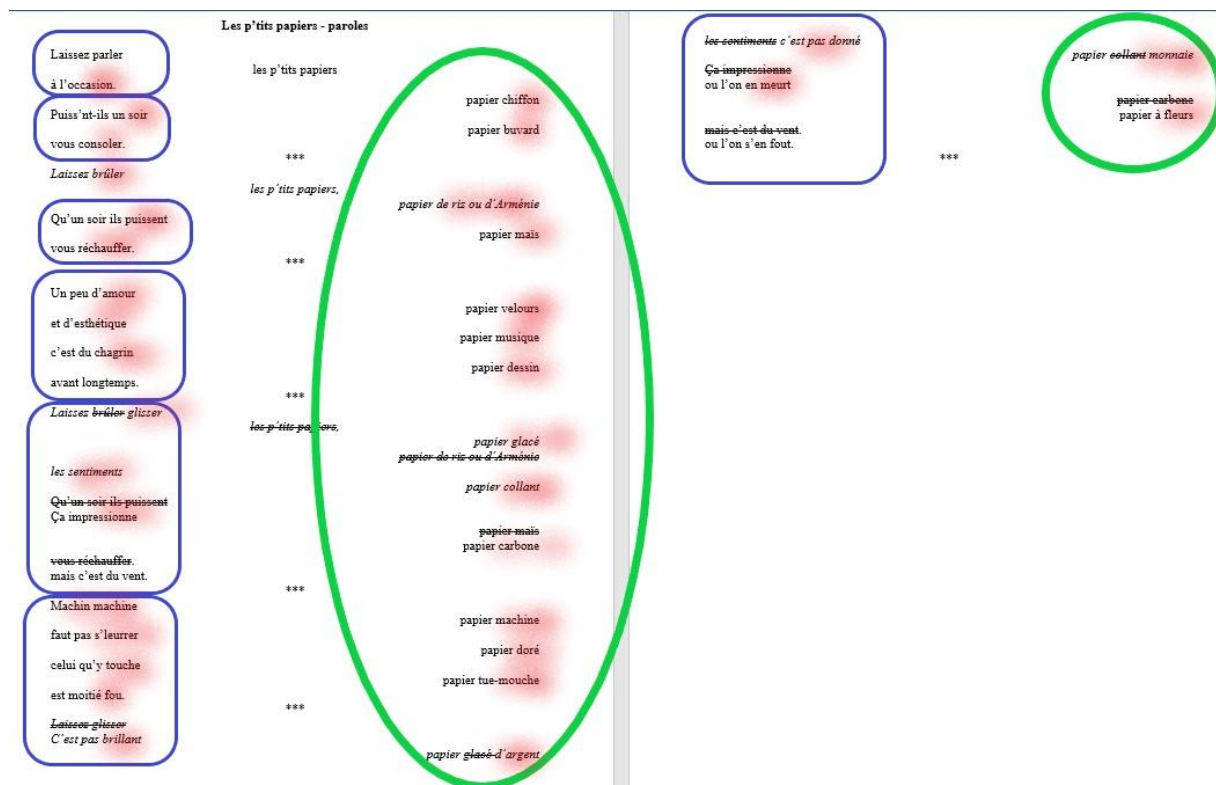
Illustration 2 : Texte des « P'tits papiers ». Visualisation des deux ensembles lexicaux contrastés et des liens établis par les rimes et les effets de sens (en rose)

Mais une difficulté poétique plus grande tient au rapport de sens souvent subtil que les noms de papiers établissent avec la phrase interrompue : ils ont, plus qu'interruption, écho, quoique profanateur, du discours « au premier degré » tenu par l'autre partie du texte. Ils en établissent un « second degré » ironique (Rudent - Lebrun).