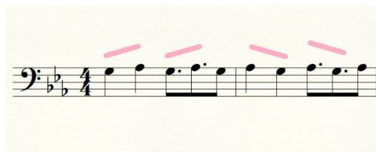
illustration 4 : « Ford Mustang », effet de miroir mélodique sur « Mus à gauche, Tang 3 à droite »

ici mais une symétrie (illustration 4), l'inversion des mouvements de navette. Comme un reflet - sonore - qui inverse les traits de l'objet reflété :