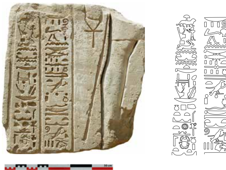
Fig. 156. Photographie couleur du bloc 326 par G. Pollin et fac-similé de l'inscription correspondante par D. Valbelle.