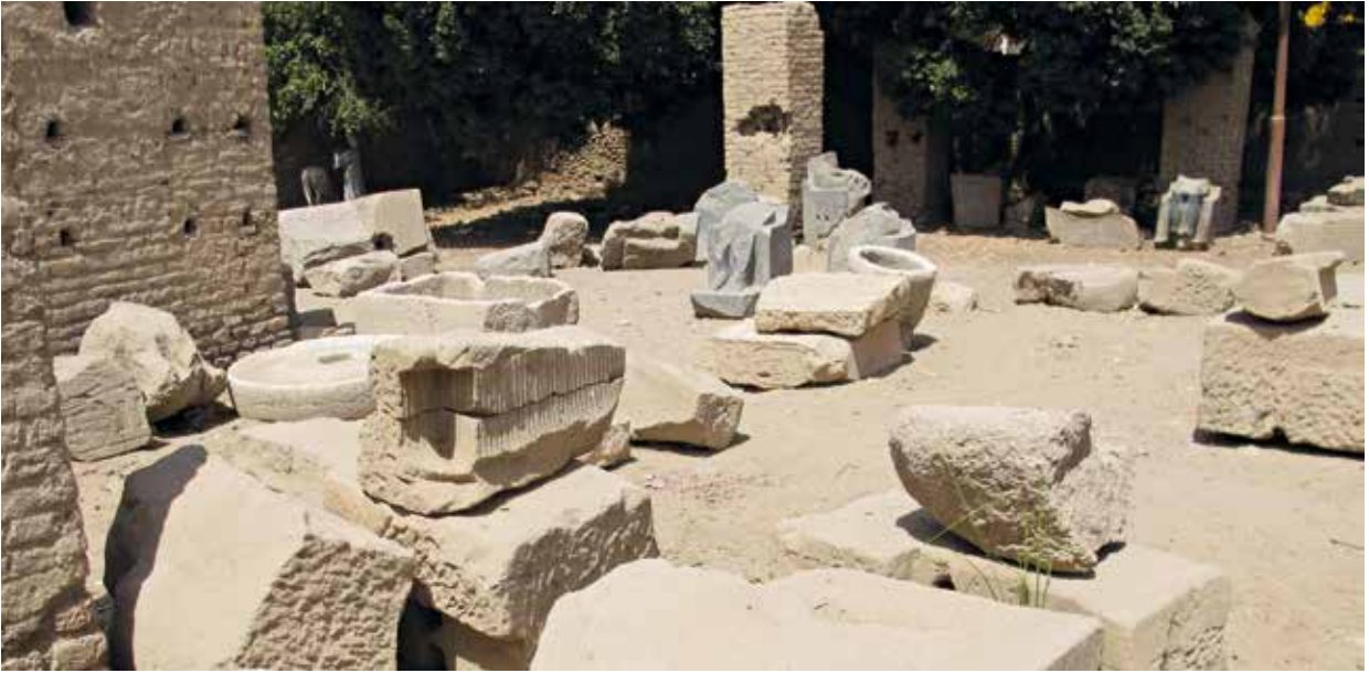
Fig. 158. Secteur des anciens magasins, prévu pour le futur musée en plein air.