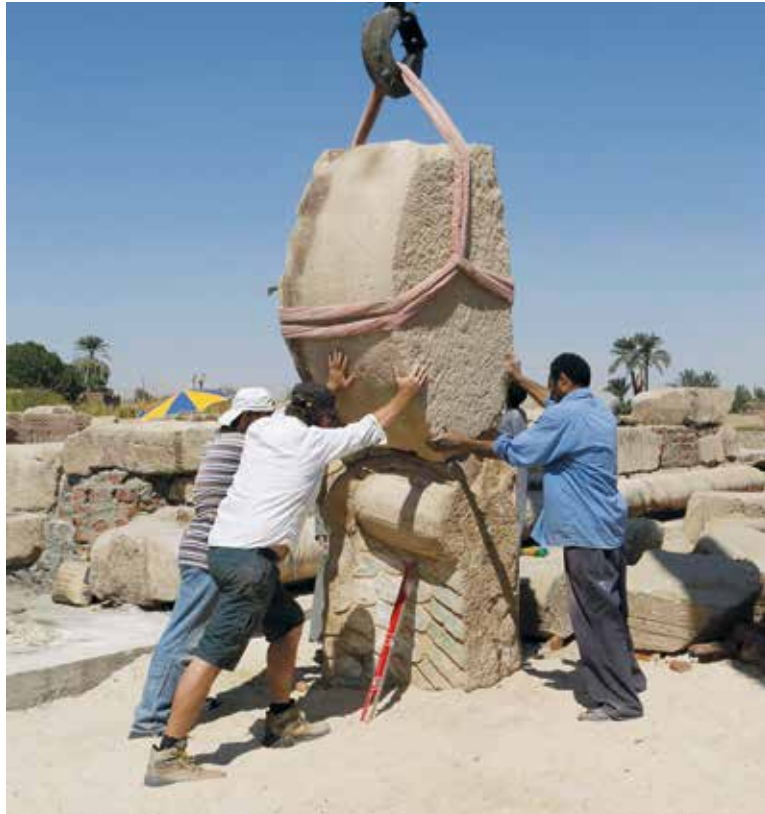
Fig. 155. Assemblage de deux blocs de corniche.