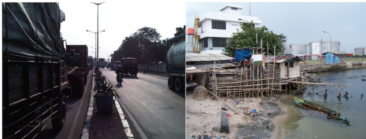
3. Deux aperçus du contact entre espaces urbains et portuaires (Desmoulière, avril 2011). À gauche, Jl. Jempea, une des grandes avenues qui sépare les espaces urbains du port (situé à droite de l'image, derrière le muret et les arbres). À droite, une forme de séparation plus ténue : le terminal des vrac liquides n'est séparé de l'habitat et des cabanes de pêcheurs que par une clôture.