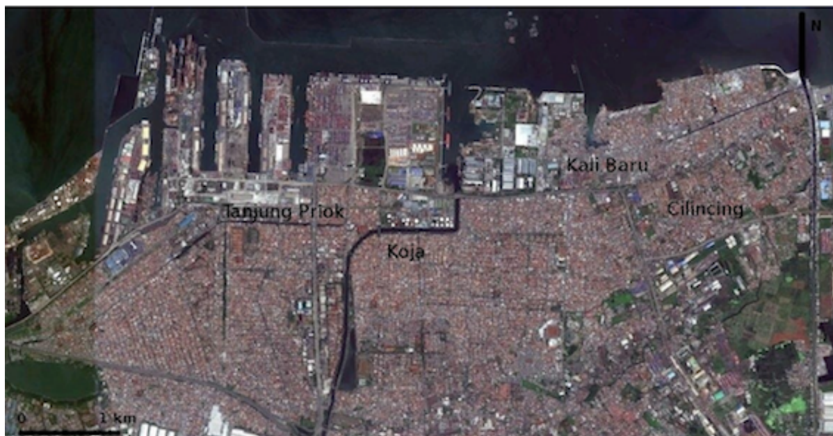
1. Vue aérienne du port de Tanjung Priok et de ses environs

Des entretiens 1 menés avec les différents types d'acteurs de l'interface, principalement des habitants, des fonctionnaires de plusieurs niveaux d'administration et des cadres du principal opérateur portuaire, l'entreprise nationale PT Pelindo II, représentent la principale source d'informations, complétée par une recherche bibliographique, l'analyse d'archives de presse et des observations de terrain.