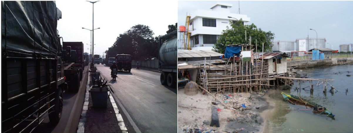
3. Deux aperçus du contact entre espaces urbains et portuaires (Desmoulière, avril 2011). À gauche, Jl. Jempea, une des grandes avenues qui sépare les espaces urbains du port (situé à droite de l'image, derrière le muret et les arbres). À droite, une forme de séparation plus ténue : le terminal des vrac liquides n'est séparé de l'habitat et des cabanes de pêcheurs que par une clôture.