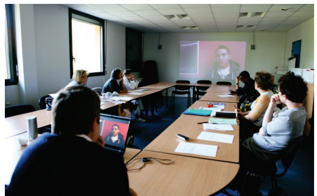
Réunion d'information avec projection du témoignage d'un ancien collégien

Les coûts occasionnés par le programme sont essentiellement les coûts de conception et de production des DVD et des guides mis à disposition des principaux pour identifier les élèves cibles et mener les réunions d'information. Il s'agit donc surtout de coûts fixes, dont le niveau n'augmente pas avec le nombre d'élèves concernés par le programme.