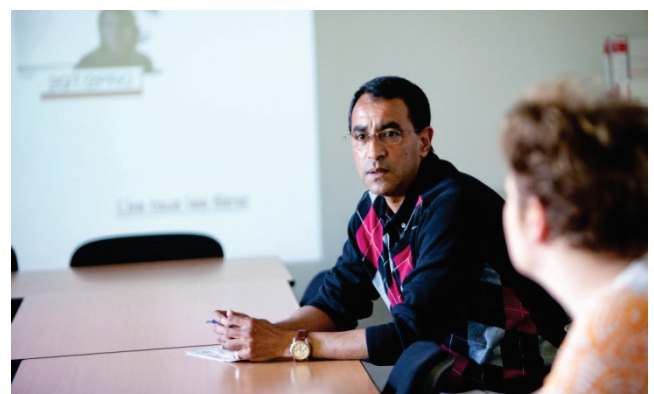
Echanges entre parents lors d'une réunion

Ainsi, en faisant évoluer les aspirations de jeunes exposés au décrochage l'intervention du chef d'établissement a eu pour effet indirect de protéger les liens sociaux : ce faisant ils ont maintenu les interactions entre ces jeunes, qui ont pu s'influencer mutuellement et faire, en quelque sorte, converger leurs projets en direction de la formation professionnelle.