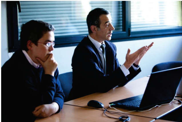
Intervention d'un chef d'établissement

D'autre part, l'intervention a induit une forte augmentation de l'apprentissage et une baisse du décrochage : la proportion de décrocheurs en fin de troisième est ainsi diminuée de 40% (elle passe de 8,8% à 5,1%). Toutes ces différences sont statistiquement très significatives, c'est-à-dire qu'elles ne sont pas le fruit d'aléas dans les échantillons enquêtés, mais reflètent des différences réelles entre les deux populations comparées.