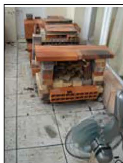
Vue générale, parois ôtées