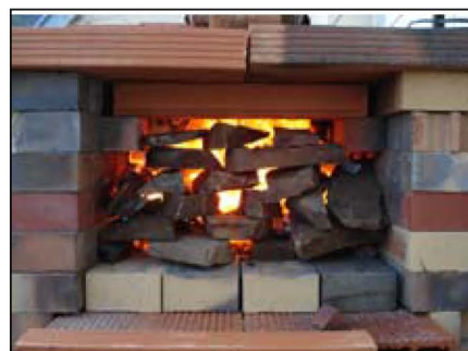
Le contre-mur à claire voie