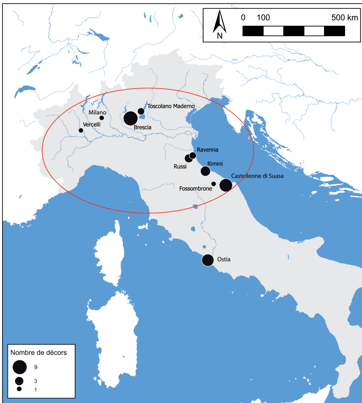
Fig. 1. Répartition des décors peints, retrouvés en contexte domestique, présentant des imitations de marbre; II e siècle ap. J.-C., Italie centrale et septentrionale (carte réalisée par l'auteur).

pourrait se procurer. Deux arguments soutiennent cette idée.