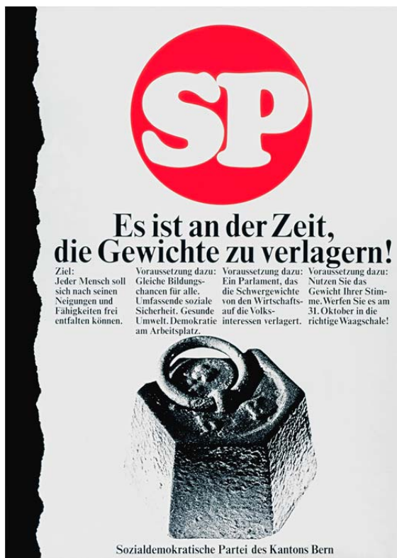
„Es ist an der Zeit die Gewichte zu verlagern!“, Sozialdemokratische Partei des Kantons Bern, 1971, Plakat, 129 x 92 cm, Graphische Sammlung der schweizerischen Nationalbibliothek, SNL_1971_426.

Frauenorganisation der Sozialdemokratischen Partei (SP) an der Konzeption der Frauenkampagne beteiligt. Das lief nicht ohne Konflikte ab. Klar kündigten sie bereits Ende 1970 an, dass die Frauenanliegen im Wahlkampf nicht als Sonderfall behandelt und insbesondere nicht auf diejenigen von Hausfrauen reduziert werden sollten – sie wünschten „kein Sonderproblem Frauen“. 53 Das von der SP mit breiten Kompetenzen beauftragte Werbebüro trennte die Frauenkampagne dennoch völlig von der allgemeinen Kampagne, die dann vor allem an die männlichen Wähler gerichtet war. Letztere drehte sich um das Motiv des Gegengewichts, das die Position der SP im politischen Kräfteverhältnis symbolisieren sollte (Abb. 2). Die Frauenkampagne übernahm hingegen eine sanfte Rosenästhetik, in deren Mitte lächelnde Frauen in der Familie und bei der Arbeit dargestellt waren (Abb. 3). Dass Arbeiterinnen und nicht nur Mütter in den Broschüren überhaupt sichtbar wurden, erfolgte erst nach einer Anfrage der sozialdemokratischen Frauen. 54