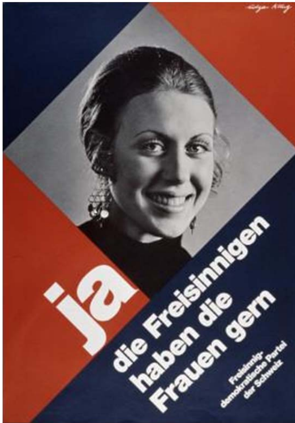
Küng, Edgar, FDP der Schweiz, 1971, Plakat, 127 x 90 cm, Museum für Gestaltung Zürich, Plakatsammlung 11-0712.

Die Parteien setzten eine ganze Palette an Vorstellungen des weiblichen Andersseins für ihre Propaganda ein. Die Schweizer BGB versah sogar ihr Image als Partei der Mitte mit weiblichen Attributen des Ausgleiches, wie auf einem Zeitungsinserat zu lesen war: