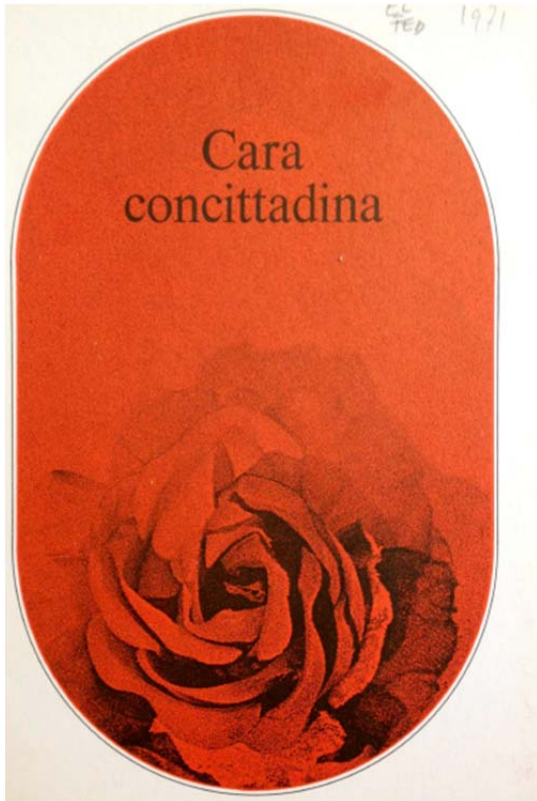
ASTi FPC 01, PST, 62.4.2.1, "Cara concittadina", 1971.

Dennoch distanzierte sich die sozialdemokratische Frauenorganisation nicht völlig von diesen Frauenbildern. Um die Frauen „für die Öffentlichkeit“ zu interessieren, empfahl eine waadtländische Leiterin der sozialdemokratischen Frauenorganisation, deren besondere Anliegen anzusprechen, wofür sie eine Umfrage über Erziehungsthemen als Vorbild nahm. 55 „Teenachmittage“ wurden auch mit einer Kinderbetreuung organisiert, um mit Hausfrauen über die Wahlen zu sprechen. 56 Spannend ist auch die Figur der „grünen Witwe“, die im Kanton Zürich im Wahlkampf anlässlich einer Veranstaltung namens „Rote Rosen für grüne Witwen“ benutzt wurde. 57 In den Worten der Partei verband diese Figur eine typisch weibliche Erfahrung in der Schweiz der 1970er Jahre – das Hausfrausein in der Vorstadt – mit dem gesamten Sozialproblem der Wohnungsnot, einem traditionell sozialdemokratischen Anliegen.