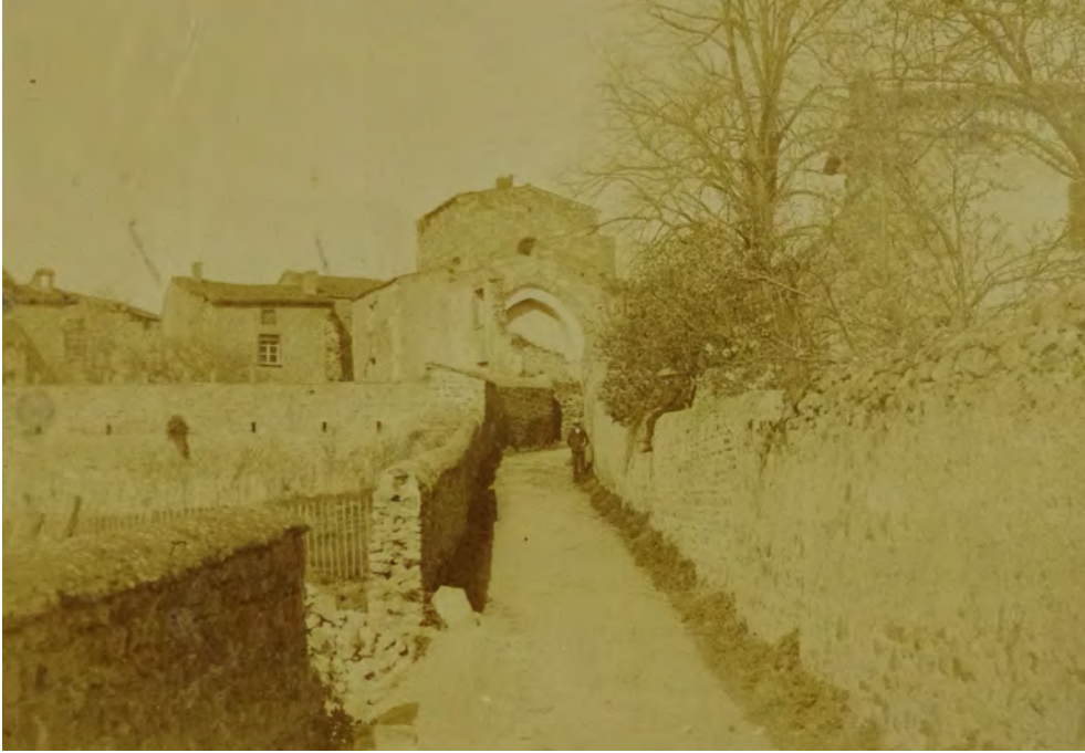
Figure 7. Vue ancienne des vestiges de l'église Sainte-Marie prise depuis l'est par Amédée Cateland (avant 1914).

Crédits : Musée historique de Lyon, Hôtel Gadagne (non inventorié).