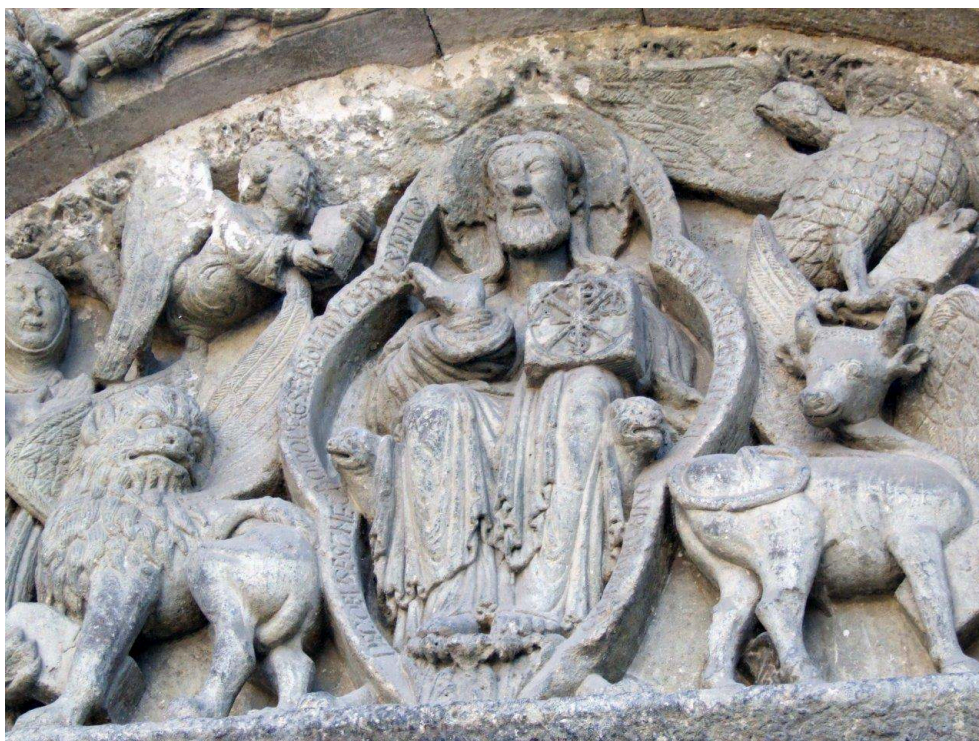
Fig. 4 – Estella, église Saint-Michel. Tympan de la porte nord.