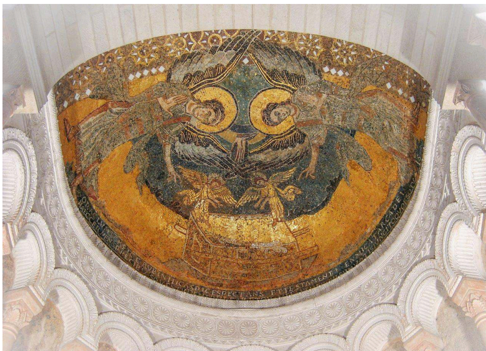
Fig. 5 – Germigny-des-Prés, oratoire. Mosaïque de l'abside.