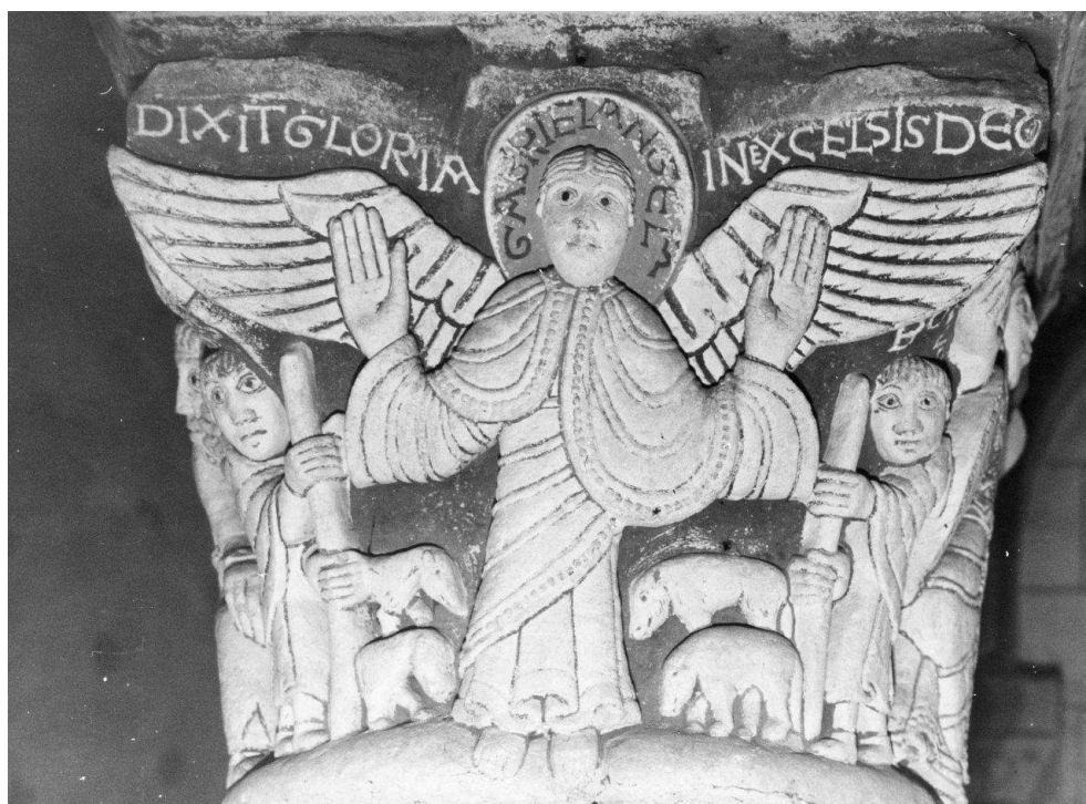
Fig. 6 – Chauvigny, église Saint-Pierre. Chapiteau de l'annonce aux bergers.

dans le lieu où l'ange sculpté rejoint le chœur des chanoines entonnant le Gloria à chaque célébration de l'eucharistie.