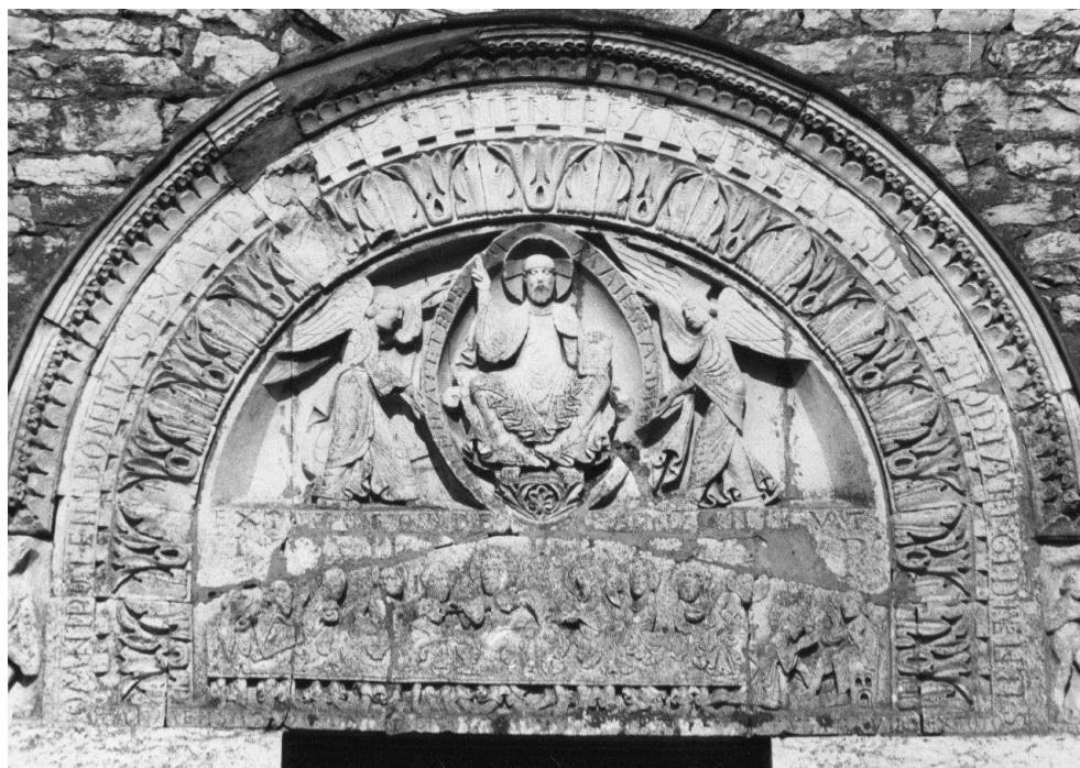
Fig. 2 – Vandeiens, église Saint-Pierre. Tympan © CESC/M/CIFM.

Que la toute-puissante Bonté exauce ceux qui entrent. Que l'ange de Dieu protège ceux qui sortent. Que la majesté du Seigneur bénisse aussi cette église. Lorsque le pécheur s'approche de la table du Seigneur, il importe qu'il abandonne les fautes de tout son cœur 11 .