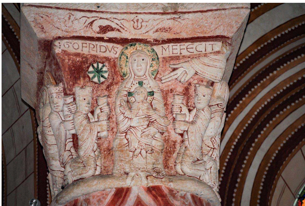
Fig. 7 – Chauvigny, église Saint-Pierre. Signature de Gofridus .