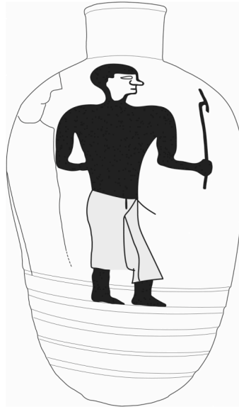
Fig. 4 : Jarre E. 3614 et déroulé du décor