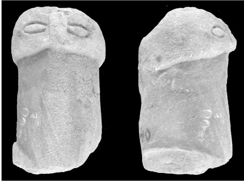
Fig. 1 : Tête d'oiseau Ba (face et profil droit), SNM 3737/1