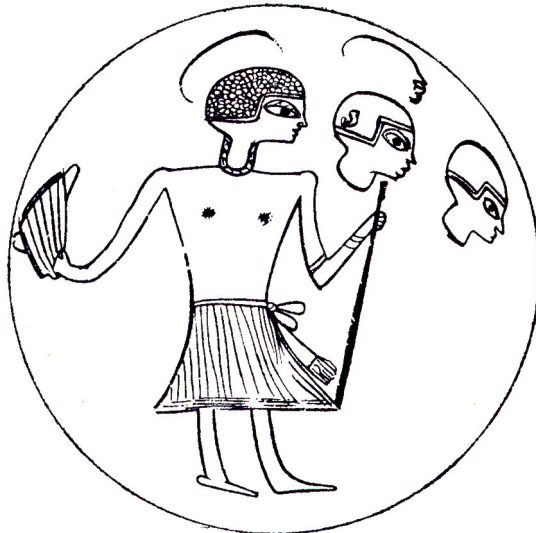
Fig. 5 : Vase 1980/98/39, tombe 16 de Nag Gamus (d'après Almagro 1965, p.56, fig. 41)