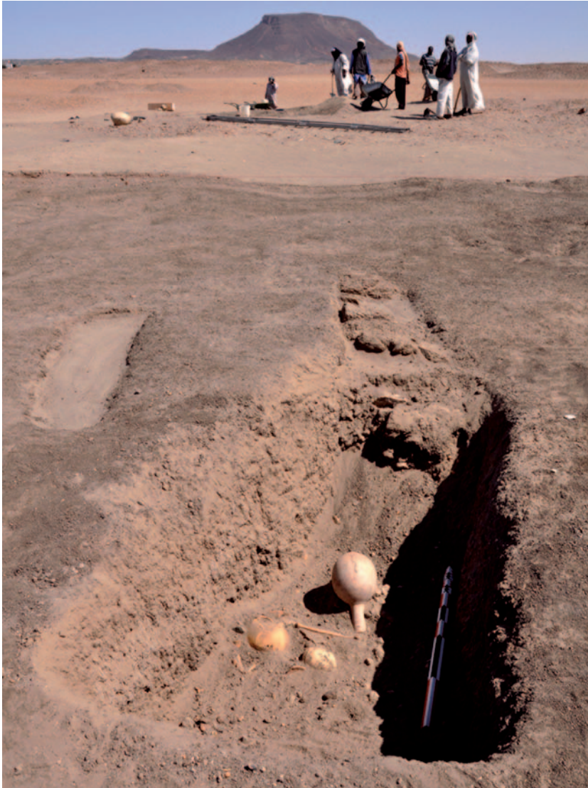
Découverte d'une bouteille globulaire à long col dans la rampe d'accès à une tombe méroïtique de la nécropole 8-B-5.A.