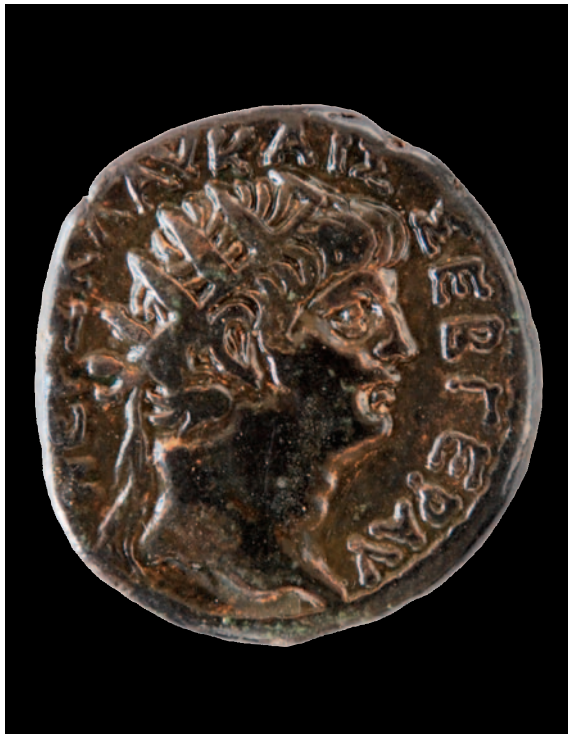
La découverte de monnaies romaines est rarissime au sein du royaume de Méroé dont l'économie n'était pas monétaire. Ici, un tétradrachme de Néron. Cliché V. Francigny.

et identifie le toponyme Sye (Saï) sur des textes recueillis dans les grands sites de Basse Nubie que sont Philae, Faras et Karanog. Poursuivant ses recherches, une trame des principaux établissements dans le nord de l'Empire se met alors en place, mais l'archéologie ne confirme toujours pas l'importance de l'île à cette époque.