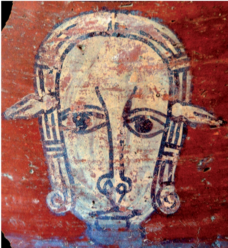
Hathor, dont cette peinture sur céramique nous montre le visage orné de ses oreilles de vache, était une des figures majeures du panthéon méroïtique hérité de l'Égypte.

Ce paradoxe, Jean Vercoutter l'a en tête lorsqu'il débute un programme de fouilles d'envergure à Saï en 1954. Il est le premier égyptologue français à ouvrir une concession de fouille au Soudan, et son choix est aiguillé vers Saï en raison du potentiel exceptionnel du lieu et de la présence de vestiges égyptiens. Sur place, il entreprend d'abord de dégager la partie sud de la ville pharaonique recouverte d'une forteresse tardive d'époque ottomane. Cinq grandes phases d'occupation se révèlent alors dans une stratigraphie haute de plusieurs mètres : égyptienne, méroïtique, post-méroïtique, chrétienne et ottomane. S'installant après une période d'abandon de la ville par les Égyptiens, les Méroïtes y construisent des bâtiments en brique crue qui réutilisent parfois des éléments architecturaux égyptiens, notamment pour les seuils et les colonnes en pierre. Ces quartiers d'habitats dotés de zones de stockage s'étendant au-delà de l'enceinte pharaonique ne nous donnent cependant qu'une vision partielle de ce relais de l'Empire. Le mobilier archéologique qu'on y trouve est difficilement interprétable, les niveaux ayant été très perturbés au fil des siècles et de l'activité humaine. La découverte d'un établissement méroïtique fait cependant date, mais il faudra attendre plus de 50 ans avant que de nouvelles pièces ne soient versées à ce dossier.