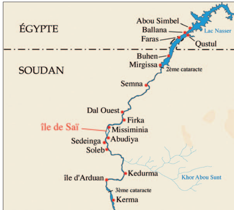
L'île de Saï, au sud de la deuxième cataracte du Nil et du Lac Nasser.

Le réveil de l'île s'effectue durant la période romaine, au moment où Méroé est au faîte de sa gloire, mais les preuves de ce renouveau restent longtemps cachées aux yeux des archéologues. L'enquête débute lorsque qu'en 1842, Frédéric-Guillaume IV de Prusse lance une expédition scientifique basée sur le modèle de la campagne d'Égypte initiée par Napoléon Bonaparte. Emmenée par le professeur Richard Lepsius, la mission remonte le Nil au-delà de la frontière égyptienne avec l'idée d'y découvrir une civilisation plus ancienne que l'Égypte pharaonique. Bien que ce but ne fût jamais atteint, l'opération permit la localisation et l'étude de centaines de sites soudanais. C'est lors de ce périple que le savant effectua un bref séjour sur l'île de Saï où il préleva quelques blocs décorés égyptiens ainsi que pour la première fois, une inscription énigmatique d'origine méroïtique. Au début du XX e siècle, il est suivi par le père du déchiffrement de la langue méroïtique, F. Griffith, qui découvre deux nouvelles inscriptions sur place