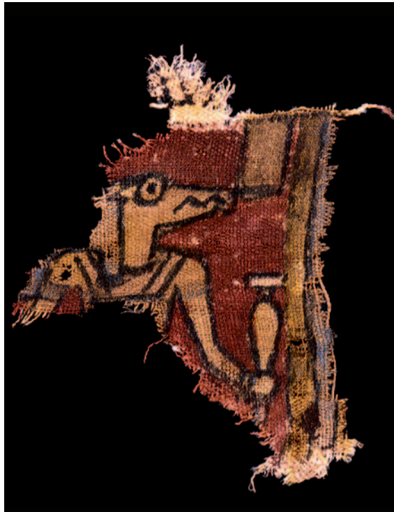
Témoin de l'influence égyptienne sur les cultes nubiens, cette représentation du dieu crocodile Sobek était peinte sur un linceul funéraire méroïtique.