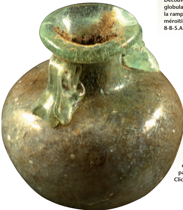
Ce petit vase en verre retrouvé intact dans une tombe était à l'origine rempli d'essence végétale parfumée.

de deux tumuli post-méroïtiques au sud-ouest de la ville. Plutôt qu'un unique puits d'accès au centre de chaque tertre, les archéologues découvrent avec étonnement une dizaine de fosses à la surface du sol fraîchement dégagé. Correspondant à autant de tombes plus anciennes dotées d'un mobilier funéraire très fruste, elles sont alors publiées comme étant les premières attestations funéraires méroïtiques sur l'île. Mais en 1974, la reprise des fouilles dans la zone contredit cette assertion, prouvant finalement que les sépultures appartiennent à la période napatéenne (dates ?).