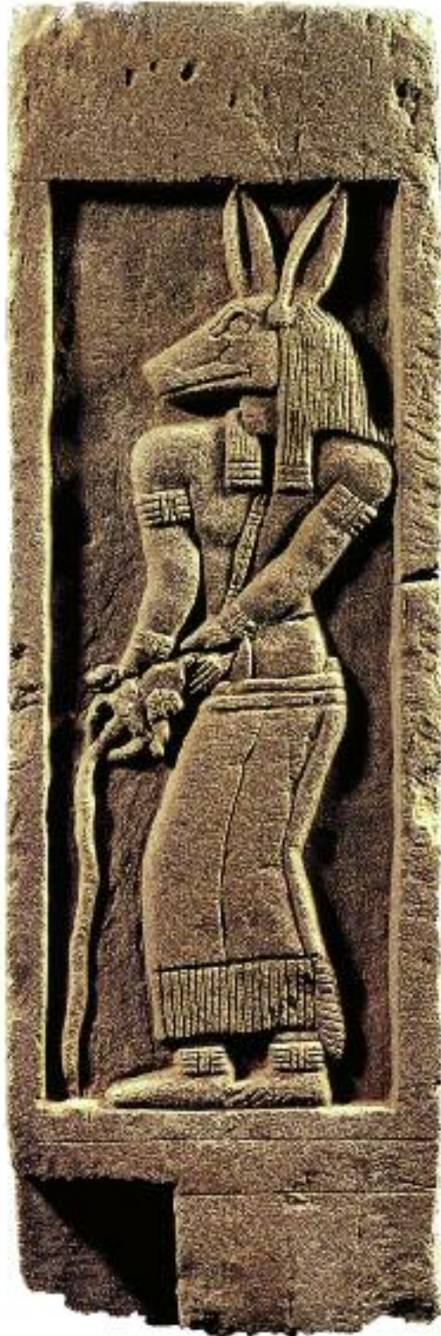
fig. 2 Montant de chapelle funéraire, (Sedeinga, Musée National du Soudan).