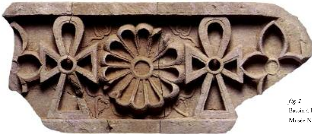
fig. 1 Bassin à libation (Naga, Musée National du Soudan).

Parmi les objets fréquemment rencontrés se trouvent les restes de tables d'offrandes dont le profil diffère selon qu'ils proviennent des temples ou des nécropoles.