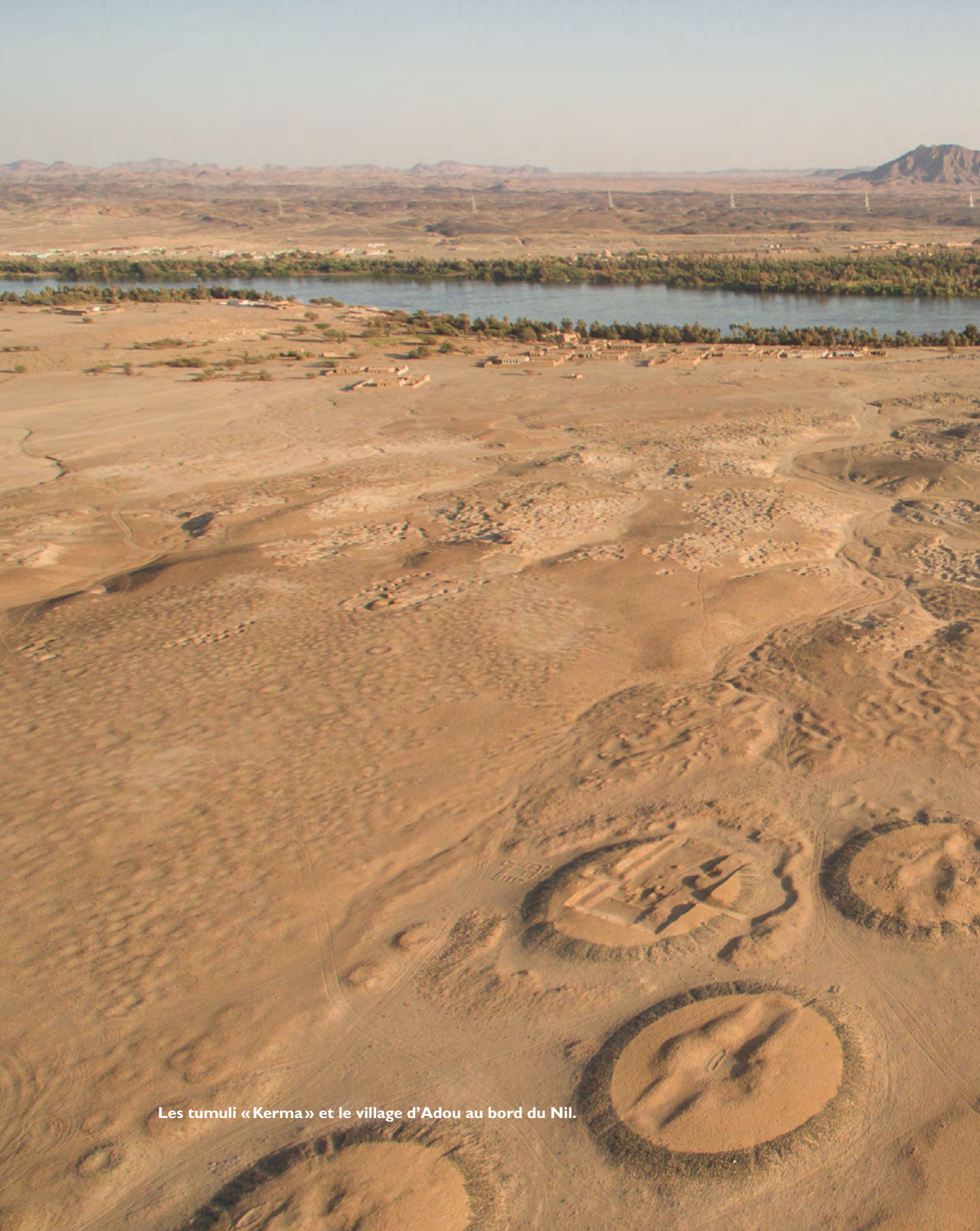
Les tumuli «Kerma» et le village d'Adou au bord du Nil.