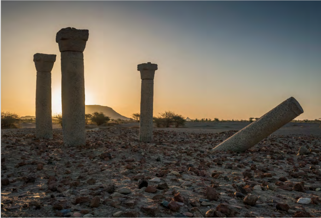
Les quatre colonnes de l'église de Saï.