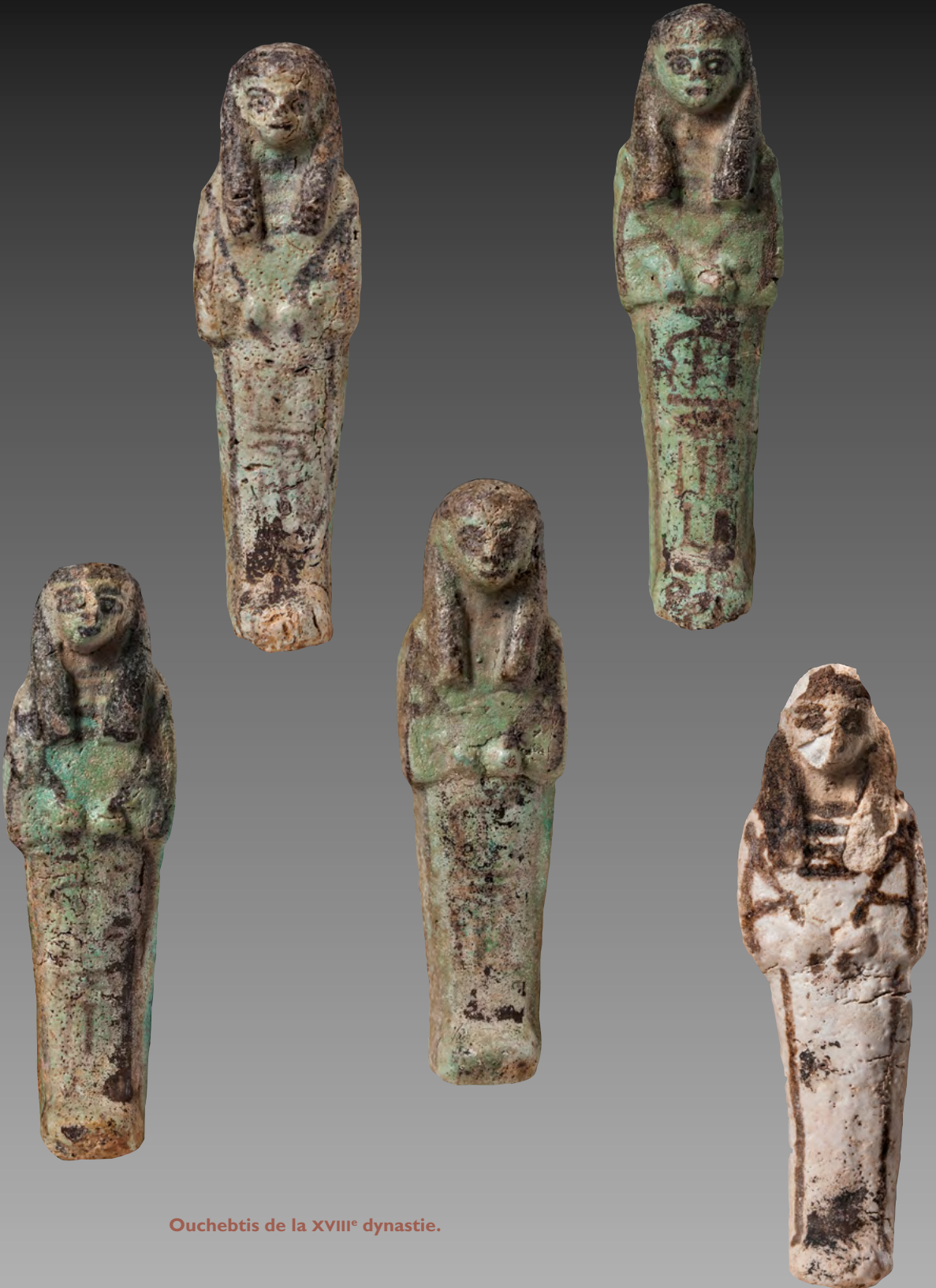
Ouchebtis de la XVIII e dynastie.