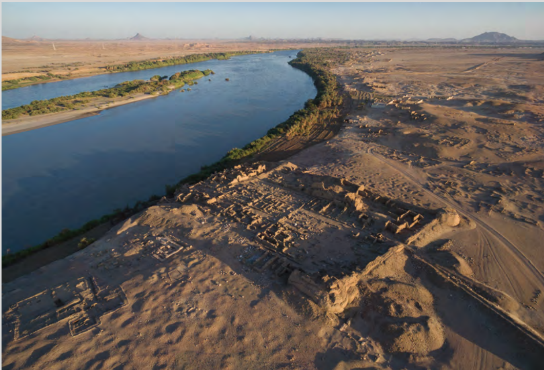
La forteresse ottomane (voir également p. 425 sq.).