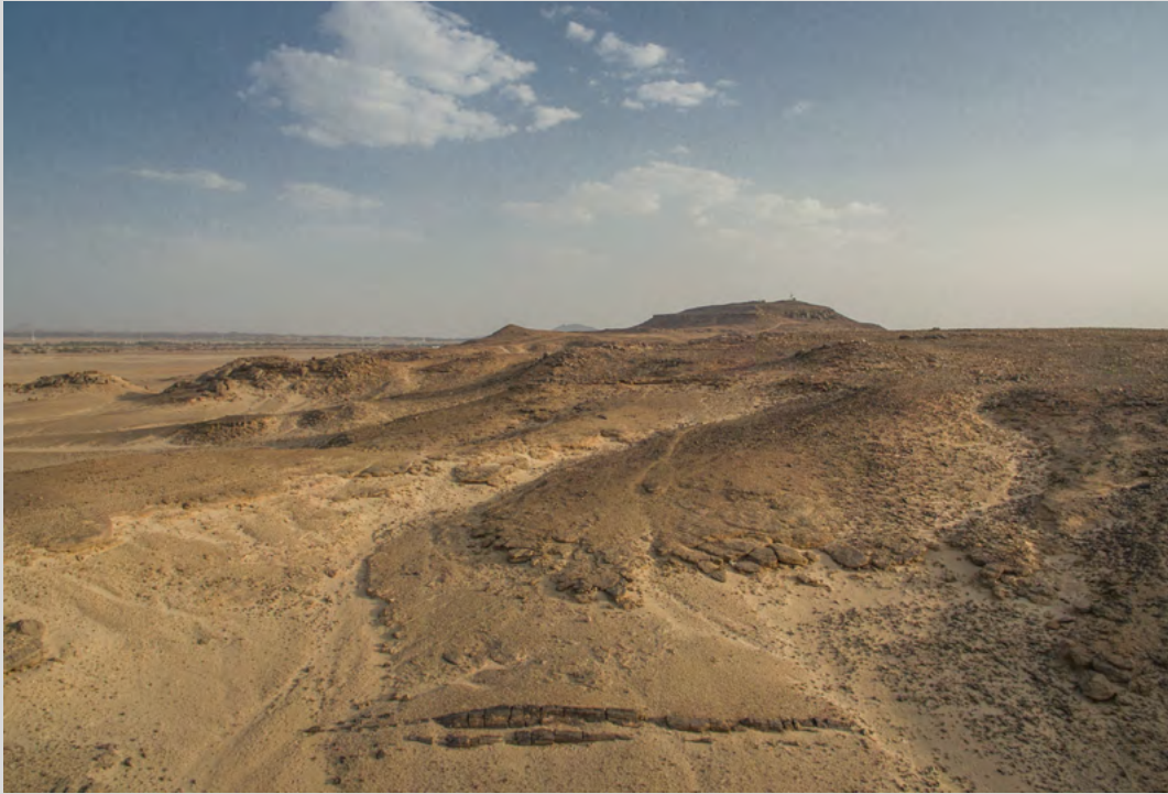
L'arbre fossile (au premier plan), témoin de la forêt du Crétacé, le Gêbel Adou et, à l'horizon, le Nil.