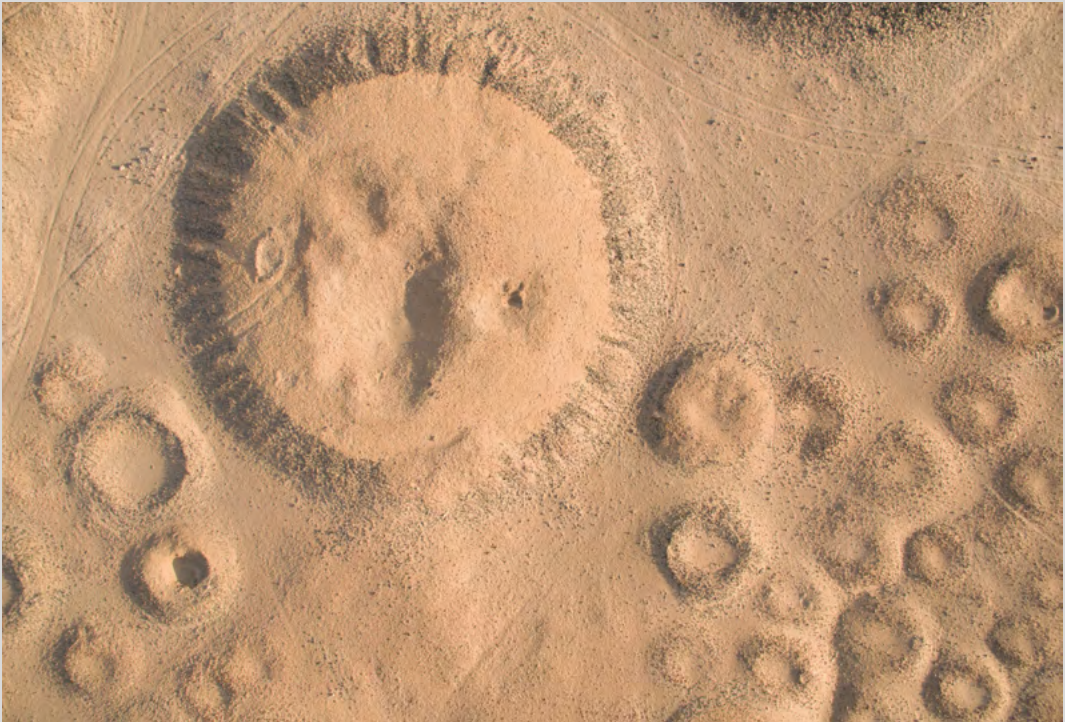
Tumuli Kerma (voir également p. 76 sq. et 520).