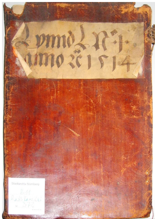
Première de couverture

Le numéro des lettres (impair pour les lettres envoyées à l'espion et pair pour les lettres envoyées par l'espion) et le caractère « a » (lettre écrite avec du lait) ou « b » (lettre écrite avec de l'encre) qui leur sont attribués serviront à identifier au premier coup d'œil la nature de la lettre considérée (notamment dans l'ouvrage mentionné plus haut). Dès lors, pour faire en sorte que tous les nombres impairs signalent une lettre envoyée à L. et les nombres pairs une lettre envoyée par L., le numéro 7 n'a pas été attribué : les lettres 6 et 8 ont en effet été rédigées et datées à quelques jours d'intervalle (il s'agit donc de deux lettres différentes) mais envoyées ensemble, donc sans qu'une réponse des citoyens ait été envoyée entretemps. Il y a donc 28 numéros pour 27 lettres.