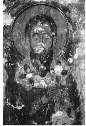
Fig. 6 : Kfar Qahel, église Mar-Élias-en-Nahr, paroi absidale : Basile

À droite d'Élie se tient « saint Basile » dont le nom est inscrit en grec (Fig. 6). Les cheveux noirs et la barbe pointue, Basile porte le sticharion , le phelonion , l' omophorion , l' epitrachelion et l' epigonation épiscopal. Il expose de ses deux mains un livre décoré de perles et de pierres précieuses. La figure qui lui fait pendant, à gauche du prophète Élie, est probablement Grégoire le Grand reconnaissable grâce à son type iconographique ayant la tête chauve, les cheveux blancs qui couvrent les tempes, la barbe ronde et large (Cruikshank-Dodd 2004 : 182 ; Hérou 2008 : 26). Il porte également le sticharion , le phelonion , l' omophorion , l' epitrachelion et l' epigonation et expose le Livre de sa main gauche alors que par sa droite, ramenée devant le buste, il effectue un geste d'allocution. De l'inscription qui l'accompagne, il ne reste que le mot « saint » écrit en syriaque. Encore plus à droite on discerne le reste d'une figure qui devait être celle de saint Paul selon le reste de l'inscription syriaque qui l'identifie. Il y aurait probablement une autre figure qui lui faisait pendant sur le côté opposé (Nordiguan 1999 : 250 ; Hérou 2008 : 26).