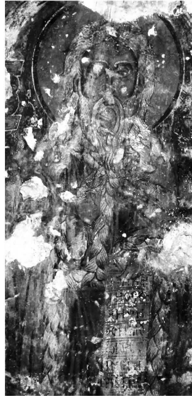
Fig. 8 : Kfar Qahel, monastère Mar-Elias-en-Nahr, peinture, paroi absidale : Élie

On pourrait supposer, dans cette perspective, qu'à Kfar Qahel l'image absidale d'Élie, debout derrière l'autel et portant sur son phylactère le même passage du Livre des Rois comme à Eskopi, se réfère à sa valeur eucharistique. Pourtant, ici Élie s'associe avant tout à la théorie d'apôtres et d'évêques qui l'accompagnent, comme si leurs tâches étaient, en quelque sorte, combinées.