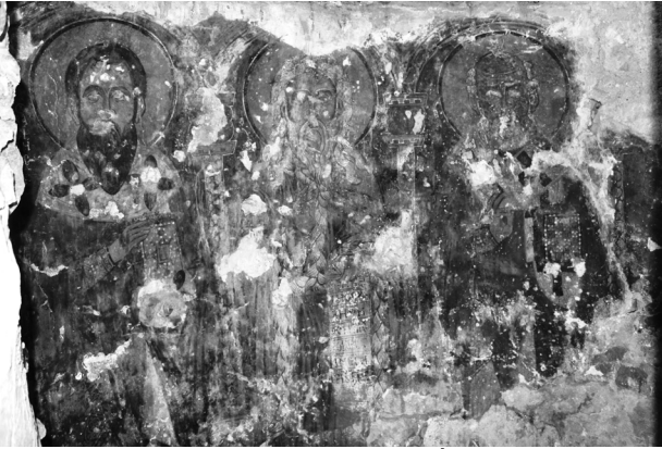
Fig. 5 : Kfar Qahel, église Mar-Élias-en-Nahr, parois absidales