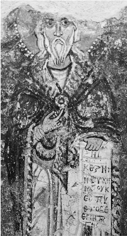
Fig. 7 : Eurytanie, église de la Dormition à Episkopi, Musée d'Athènes, peinture absidale : Élie (d'après Mathews 1997)