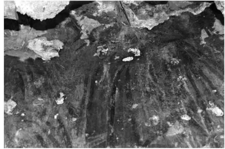
Fig. 3 : Kfar-Qahel, église Mar-Elias-en-Nahr, conque absidale : la partie inférieure du médaillon

La place d'honneur au centre est réservée au patron de l'église : le prophète Élie, dont l'inscription indiquant son nom est presque entièrement détruite. Élie est représenté en vieillard à la chevelure abondante et retombante sur les épaules, et à la barbe longue composée de plusieurs mèches. Le prophète porte la mélote traditionnelle en poils de mouton tressée aux extrémités. Ses deux mains glissent de dessous la mélote . Il effectue de la droite le geste d'allocution, alors que, de la gauche, il tient un long phylactère qui se prolonge jusqu'au niveau de ses pieds où se lit une inscription en grec inspirée de passages bibliques : « Yahwe est vivant et ton âme est vivante » (2 R. 2, 2, 4, 6), et « Par Yahweh vivant, il n'y aura ces années-ci ni rosée ni pluie sauf à mon commandement » (2 R. 17, 1) » (Cruikshank-Dodd 2004 : 181).