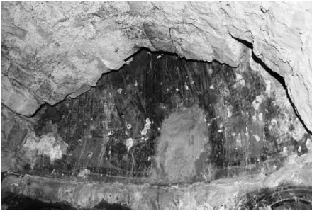
Fig. 2 : Kfar Qahel, église Mar-Élias-en-Nahr, conque absidale