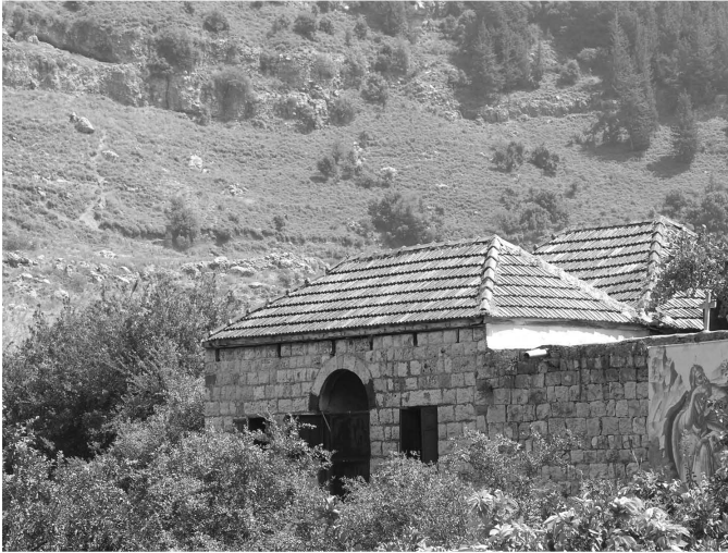
Fig. 1 : Kfar Qahel, monastère Mar-Élias-en-Nahr

des peintures médiévales qui demeurent l'unique preuve de l'ancienneté du couvent de Kfar Qahel. Ce décor peint se caractérise par un langage stylistique combinant le schématisme et la simplicité de la tradition locale, avec des traits provenant de la tradition byzantine comme le jeu d'ombre et de lumière, notamment l'ombre verdâtre qui façonne les contours des visages et des yeux. Cela montre que le style byzantin trouve à Kfar Qahel une solution locale. Ces peintures ont été datées du XIII e siècle (Hélou 2008 : 27).