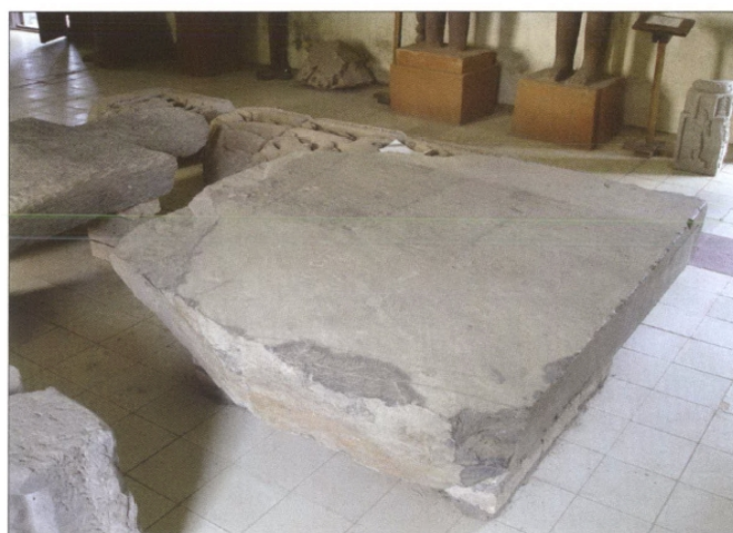
Fig. 2 : Situation de K. 1254 dans le musée d'Angkor Borei en mai 2006 (cliché : Dominique Soutif).