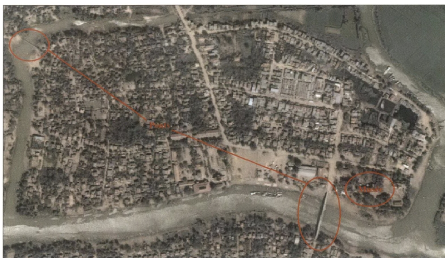
Fig. 1 : Photographie aérienne sur laquelle sont indiqués en rouge les deux ponts et le musée d'Angkor Borei.