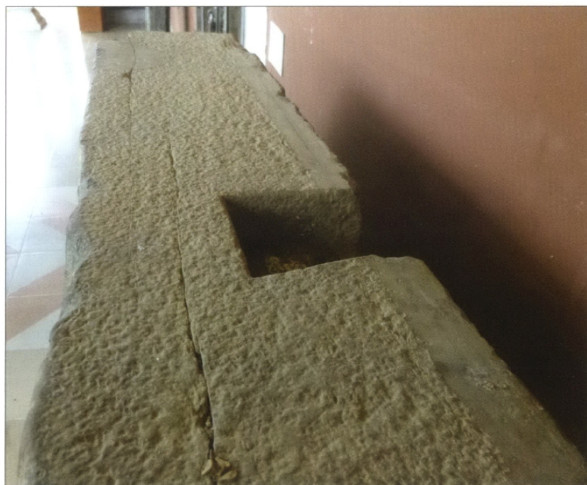
Fig. 6 : Encoche trapézoïdale (décrite dans la note 2) qui servait au maintien de la dalle en appui sur un objet, peut-être un mur perpendiculaire à la dalle.