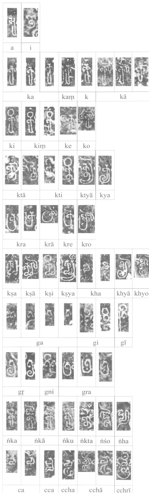
Tableau des graphèmes employés dans l'inscription K. 1254