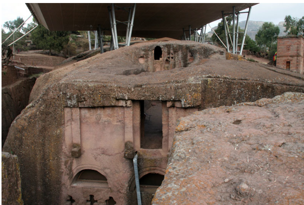
Figure 6 : La porte dans le vide au-dessus de la façade de l'église de Golgotā

29 À partir des travaux historiques et archéologiques menés récemment à Lālibalā, ce que l'on peut déduire de la méthodologie du phasage du site développée parallèlement par plusieurs chercheurs 65 permet d'estimer que la façade actuelle de Golegotā est le fruit d'un creusement postérieur à celui qui a permis l'excavation de l'église de Māryām et en particulier l'un des accès monumentaux à cette église, qui s'est trouvé tronqué lorsque la façade de Golegotā a été aménagée (fig. 6) (la fameuse porte dans le vide, mise en évidence dès les travaux d'Augusto Monti della Corte 66 ). Au cours de cette même phase, le tombeau d'Adam a été détourné puisque la découpe de la façade de Golegotā dans le rocher nécessitait d'en détacher ce qui est devenu le tombeau d'Adam. Ce morceau de rocher a été probablement réservé, telle une relique, parce qu'une tombe suffisamment importante se trouvait déjà en cet emplacement. Pour la conserver, un bloc de rocher a donc été épargné, en regard de la façade ouest de l'église de Golegotā, et a donné naissance à ce qui est désormais connu comme le tombeau d'Adam (fig. 7). Il faut toutefois souligner que l'aménagement de la façade de Golegotā a très bien pu intervenir après que l'intérieur des églises de Dabra Sinā-Golegotā-Śellāsē avait été creusé.