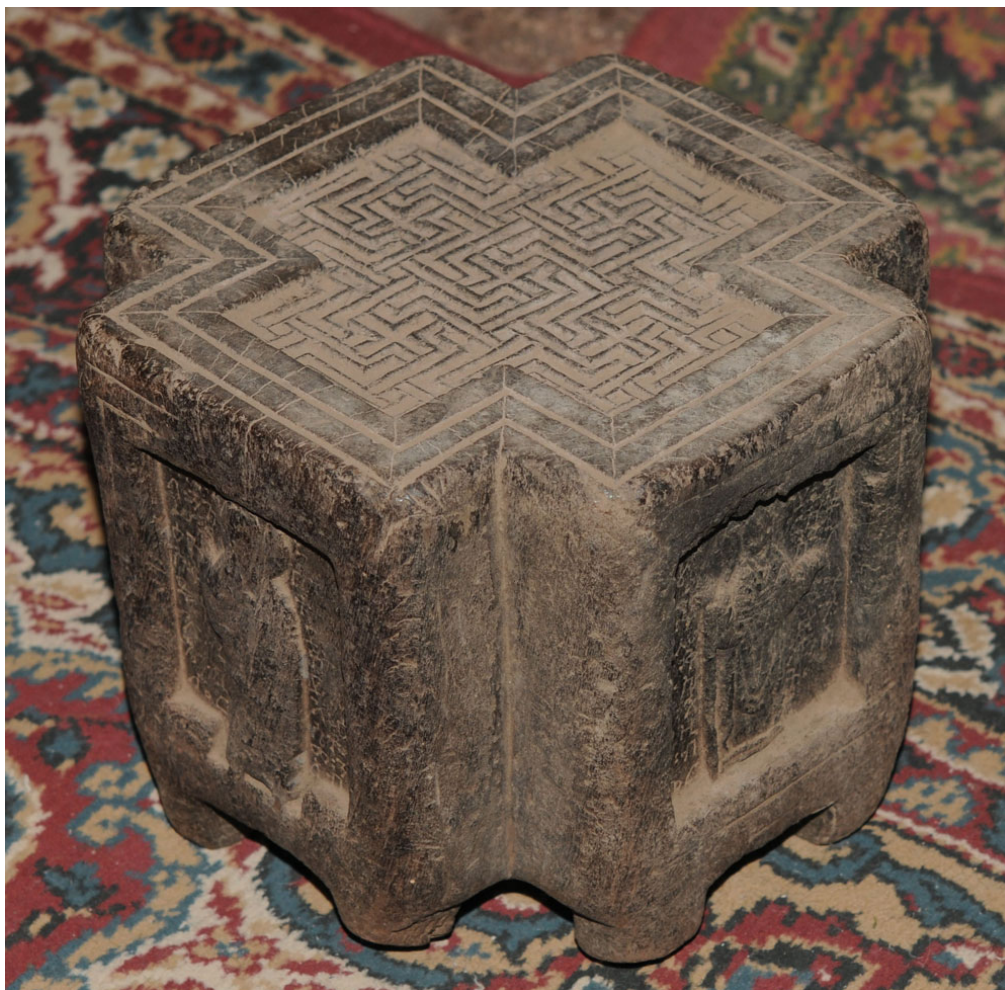
Figure 8 : Autel en bois dédié à saint Lālibalā et sainte Masqal Kebrā conservé dans l'église de Golgotā