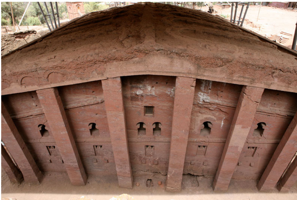
Figure 2 : Église de Bēta Madhānē Alam (groupe nord des églises de Lālibalā)