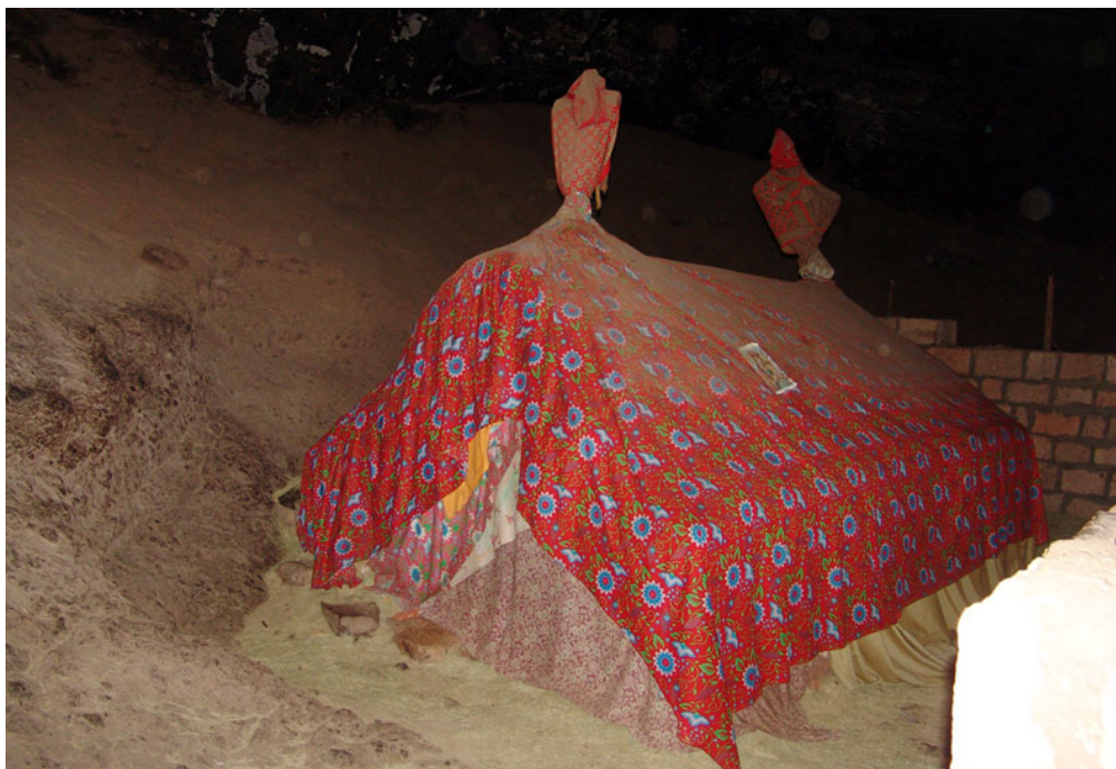
Figure 3 : Sépulture à l'est de l'église de Yemreḥanna Krestos