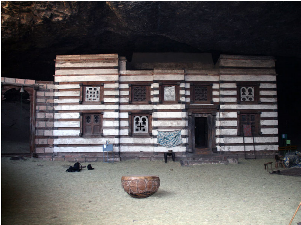
Figure 1 : Église de Yemreḥanna Krestos, construite dans l'entrée d'une grotte