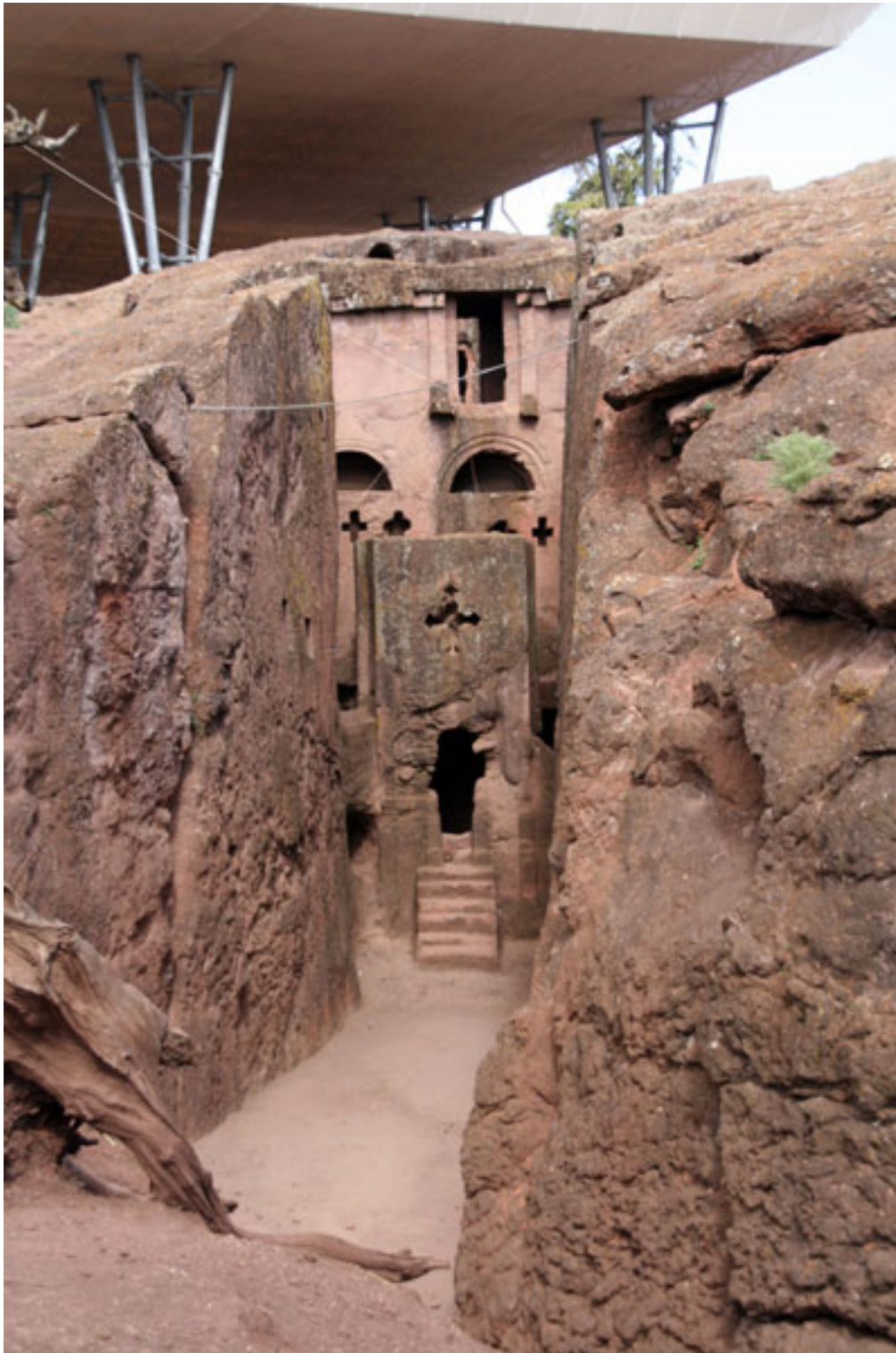
Figure 7 : Le tombeau d'Adam