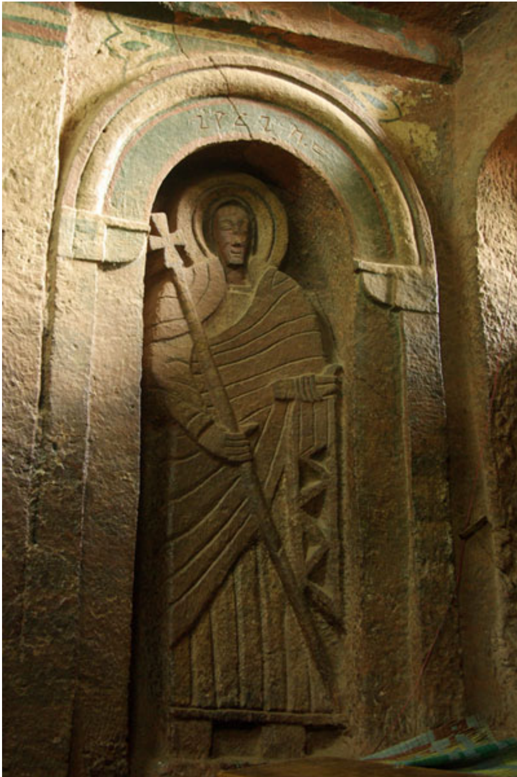
Figure 5 : Sculpture dans l'église de Golgotā