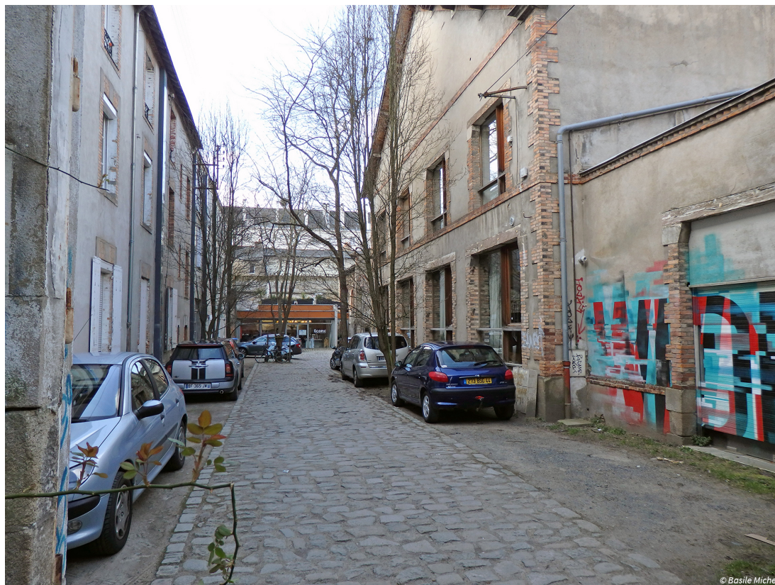
Photo 1 ? Une ruelle abritant les bureaux de nombreuses activités culturelles et créatives aux Olivettes