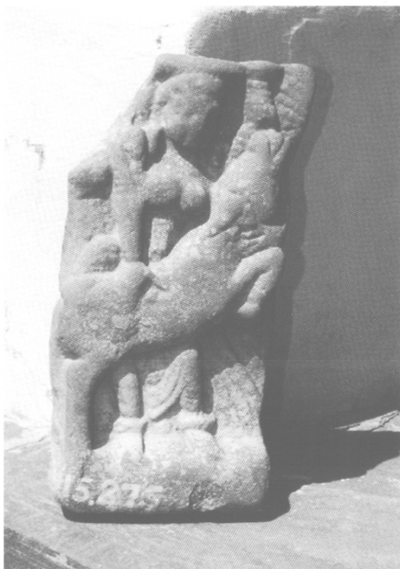
Fig. 1 – Mahiṣamardini à six bras, 1 er -II e s., Musée de Mathurā, MM 15. 875, grès.