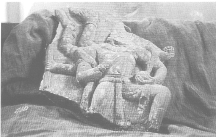
Fig. 7 – Viṣṇu à huit bras, I er -II e s., Musée de Mathurā, MM 50.3550, grès.