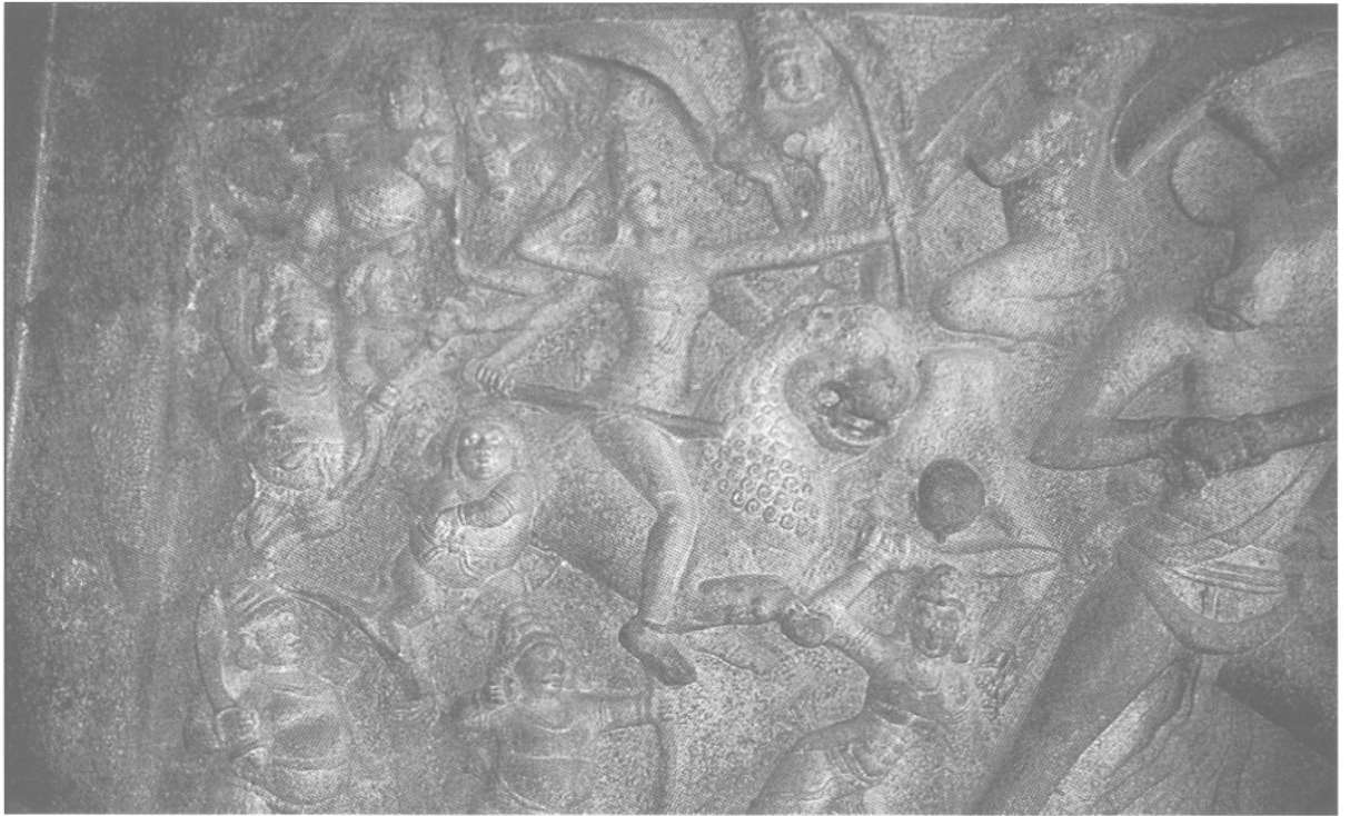
Fig. 11 – Mahiṣamardini, VI e s., Mahābalipuram (Tamil Nad), grotte de Mahiṣāsuramardini, in situ .