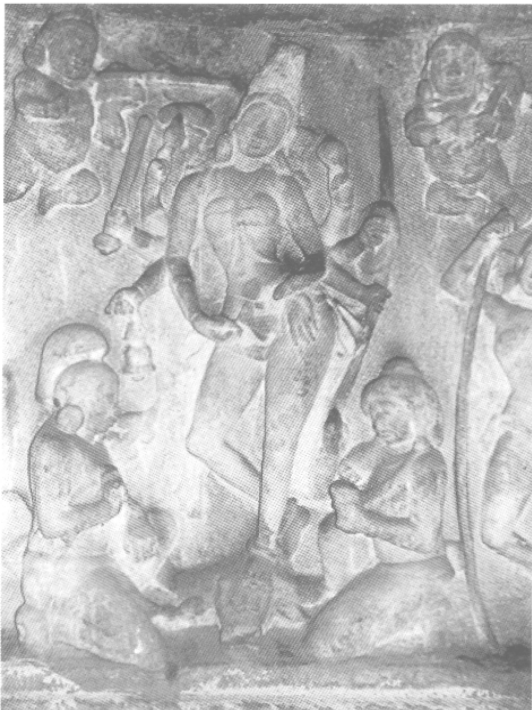
Fig. 12 – Mahiṣamardini, VI e s., Mahābalipuram, grotte de Varāha, in situ .