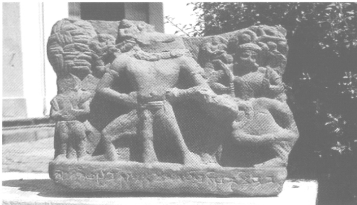
Fig. 6 – Divinité à tête de sanglier soulevant la terre hors des eaux, II e s., Musée de Mathurā, MM 65.15, grès.

Les ancêtres iconographiques connus des avatāra sont au nombre de trois. Considérons d'abord les représentations de Kṛṣṇa luttant contre le démon cheval Keśin (N. P. Joshi 1966 : pl. 64 ; Ch. Schmid 1999). Sur des haltères en pierre d'assez petites dimensions se trouve sculptée une figure humaine à deux bras, sans attributs, qui enfonce son bras dans la gueule d'un cheval. Témoignage précieux d'une double iconographie du dieu Kṛṣṇa qui a joué un rôle important dans la formation de l'iconographie krishnaïte puis vishnouïte (Ch. Schmid 1999), ces rares images partagent avec celles de Mahiṣāsura-mardīnī leur type narratif, rare à l'âge kouchan, la taille en bas-relief, le thème du combat contre un démon et le mode particulier d'une lutte où le dieu utilise ses mains nues.