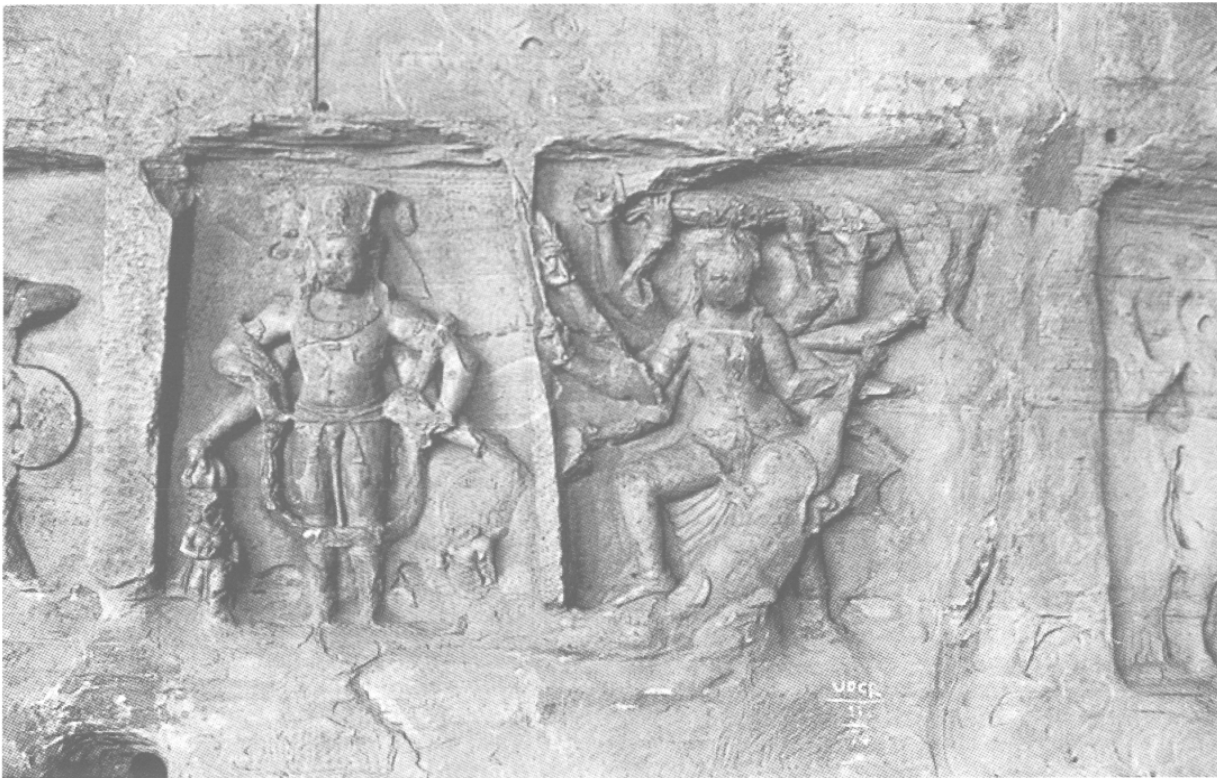
Fig. 4 – Viṣṇu à quatre bras et Mahiṣamardini à douze bras, début du VI e s., entrée de la grotte 6 d'Udayagiri (Madhya Pradesh), in situ .