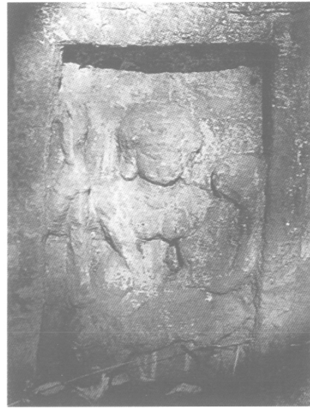
Fig. 9 – Mahiṣamardinī, v e -vi e s., Rāmgadh (Madhya Pradesh), in situ .