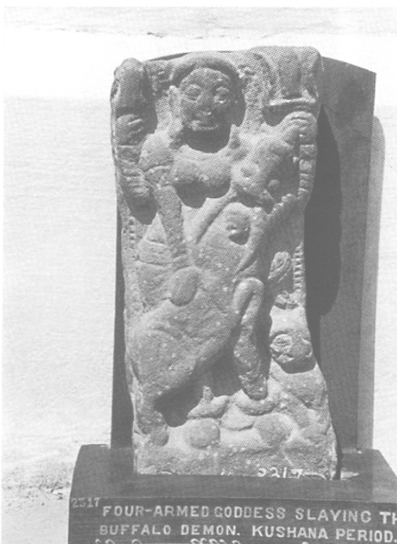
Fig. 3 – Mahiṣamardini et son lion, 1 er -II e s., Musée de Mathurā, MM 2317, grès.