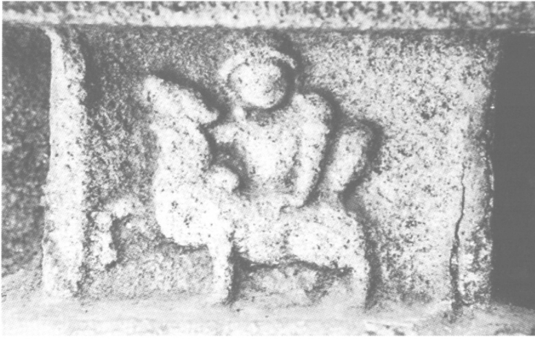
Fig. 18 – Kṛṣṇa luttant contre le taureau Ariṣṭa, x e s., Kumbakonam (Tamil Nad), in situ .

dernier le saisit par les pattes arrières et le fait tournoyer dans les airs avant de le fracasser sur le sol 126 . Les représentations de ces combats contre l'âne, contre l'éléphant et contre le taureau ne sont pas antérieures au v e siècle. Celles de la lutte contre Ariṣṭa présentent un Kṛṣṇa pressant d'une main la colonne vertébrale du taureau et lui relevant la tête de l'autre, reprenant donc l'iconographie inaugurée pendant l'âge kouchan du combat contre Mahiṣa (fig. 18), et tendant ainsi à confirmer une relation entre les deux luttes contre des bovidés. Le fragment d'une Mahiṣāsūramardīnī en provenance de Nagar dans le Rājasthān, daté des environs de notre ère, est, à cet égard, éclairant 127 . La main de la déesse se serre autour de la gorge du bovidé, dont les plis se rassemblent comme ceux du tissu mouillé qu'évoque le HV ( klinnam ivāmbaram ). N'étaient les ornements féminins, on pourrait identifier ce fragment comme une représentation de Kṛṣṇa luttant contre le taureau.