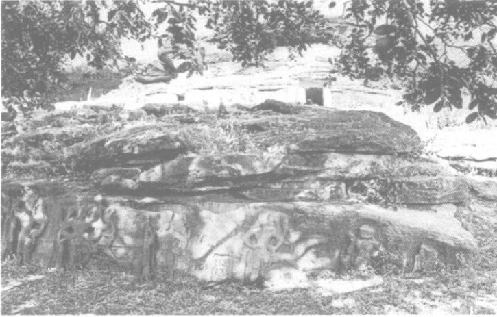
Fig. 8 – Vue du site de Rāmgadh (Madhya Pradesh), v e -vi e s. ; entre un Viṣṇu à quatre bras et un Trivikrama huit bras, on distingue la petite représentation de Mahiṣamardinī (cf. fig. 10).