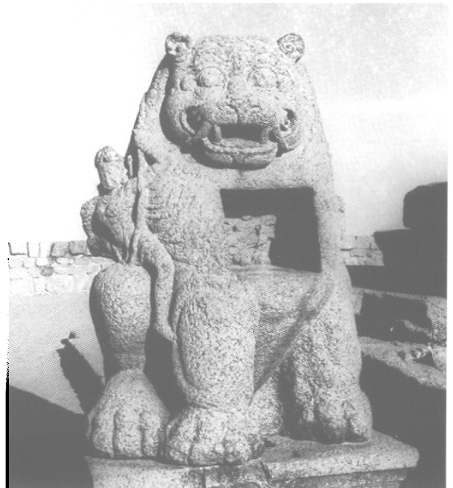
Fig. 13 – Le lion de Mahiṣamardini, VII e s., Mahābalipuram, Temple du rivage, in situ . © Institut français de Pondichéry, 6079. 12.