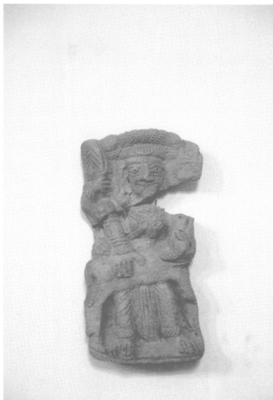
Fig. 2 – Mahiṣamardini à six bras, 1 er -II e s., Musée de Mathurā, MM 2715, terre cuite.