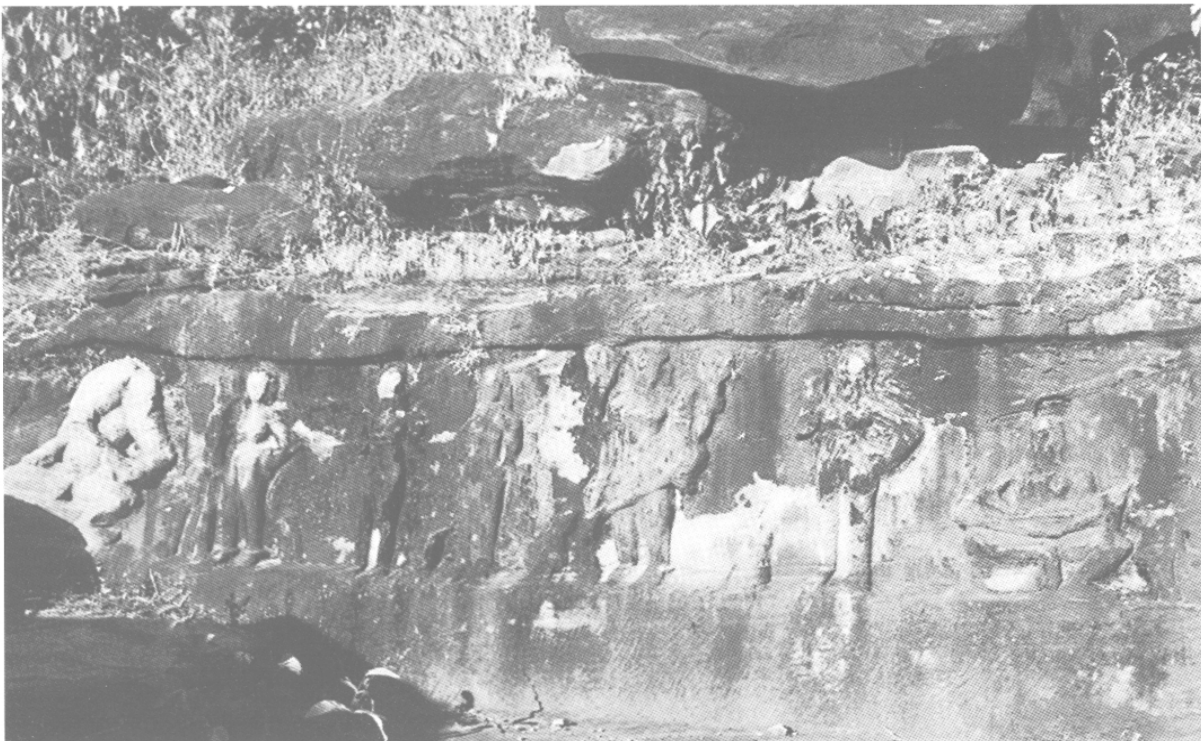
Fig. 10 – Mahiṣamardinī dans la rangée de mères (au centre, 3 e figure à partir de la droite), v e -vi e s., Rāmgadh (Madhya Pradesh), in situ .