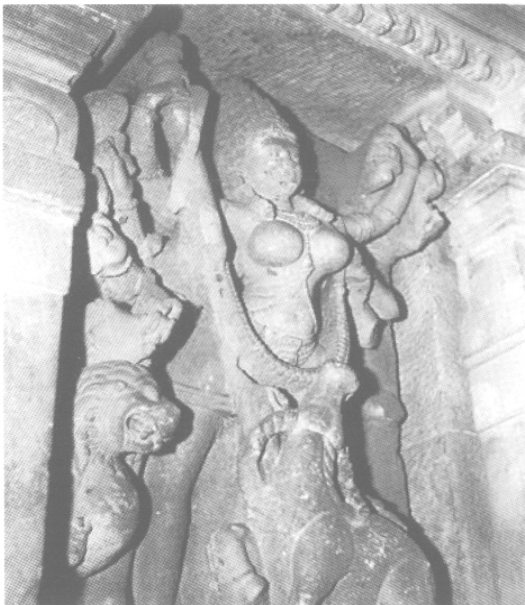
Fig. 5 – Mahiṣamardini, VI e s., temple de Durgā, Aihole (Karnataka), in situ .

Les liṅga sont en ronde-bosse, Kṛṣṇa et Saṃkarṣaṇa se présentent sous la forme de hauts-reliefs ou de rondes-bosses 11 .