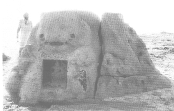
Fig. 16 – Le rocher de Mahiṣa, VI e s., Mahābalipuram, in situ .