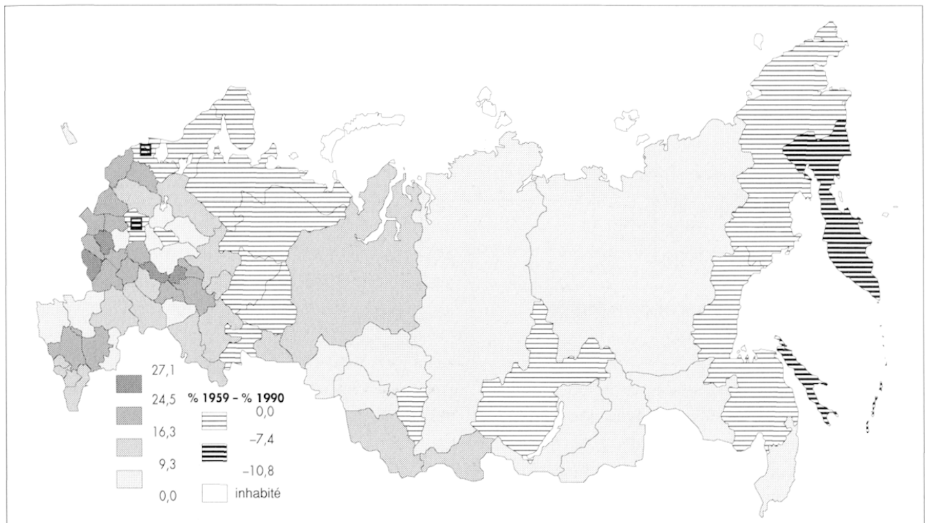
Fig. 2.— Les trajectoires de l'emploi industriel dans les régions (1959-1990).