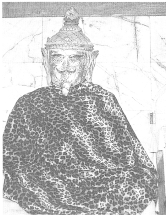
5 – L'ermite de Doi Suthep au Wat Phra Boromathat Doi Suthep