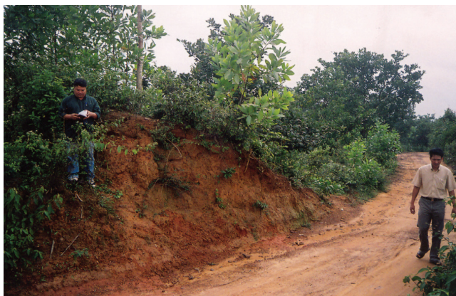
FIG. 2. – L'architecture de la muraille : terre battue. Commune de Long Son, district de Minh Long, province de Quảng Ngãi, 2008.