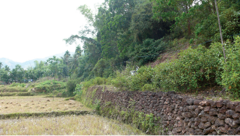
FIG. 10. – Bordure d'une rizière Hrê, revêtue en pierre. Commune de Son Kỳ, district de Son Hà, province de Quảng Ngãi, 2011.