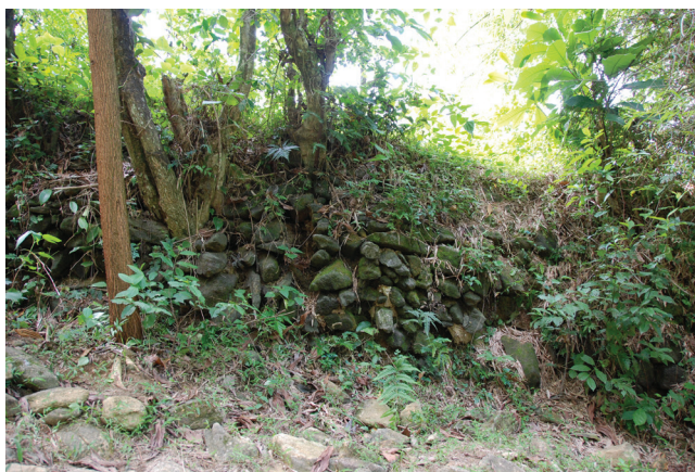
FIG. 3. – L'architecture de la muraille : pierre sèche. Commune de Trà Phú, district de Trà Bồng, province de Quảng Ngãi, 2008.