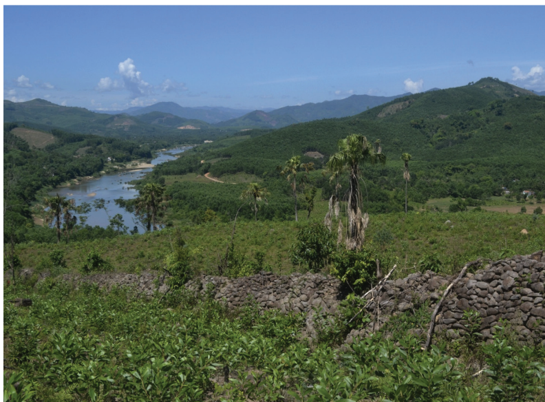
FIG. 1. – La muraille de Quảng Ngãi, construite en 1819. Village de Tân Long Hạ, commune de Ba Động, district de Ba Tư, province de Quảng Ngãi, 2015.

fois le dispositif mis en place à l'origine 6 . Nguyễn Tấn décrit ses campagnes militaires ainsi que ses pourparlers avec les chefs Hrê, et il note même les noms de ces derniers : Đĩnh-y pour la Première Marche, Đĩnh-gi et Đĩnh-lai pour la Deuxième Marche, etc 7 .