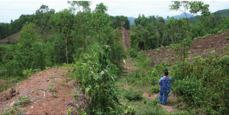
FIG. 6. – Une route longe la muraille. Commune de Sơn Hạ, district de Sơn Hà, province de Quảng Ngãi, 2010.