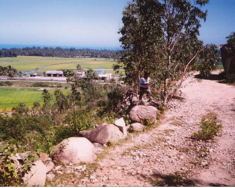
FIG. 5. – Vestiges d'une route ancienne. Commune de Phố Châu, district de Đức Phổ, province de Quảng Ngãi, 2006.