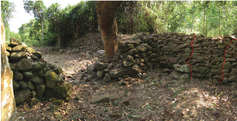
FIG. 9. – Au fort de Rùm Đôn, la muraille et la route N-S qui passe par une porte dans le mur transversal. Sur l'extrême droite de l'image : une porte, aujourd'hui comblée, permettait le passage E-O à travers la muraille, 2010.