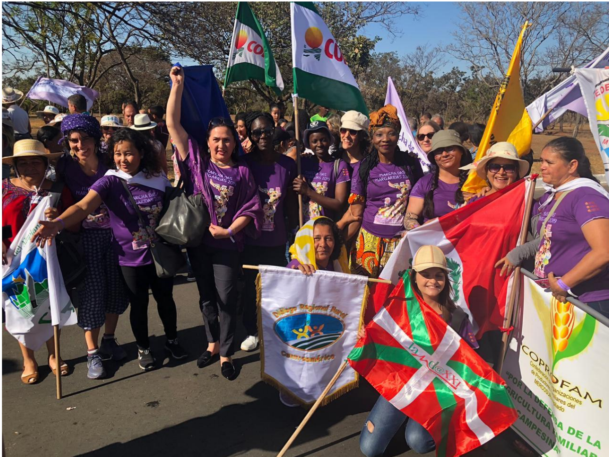
Marche des femmes à Brasilia le 14 août 2019