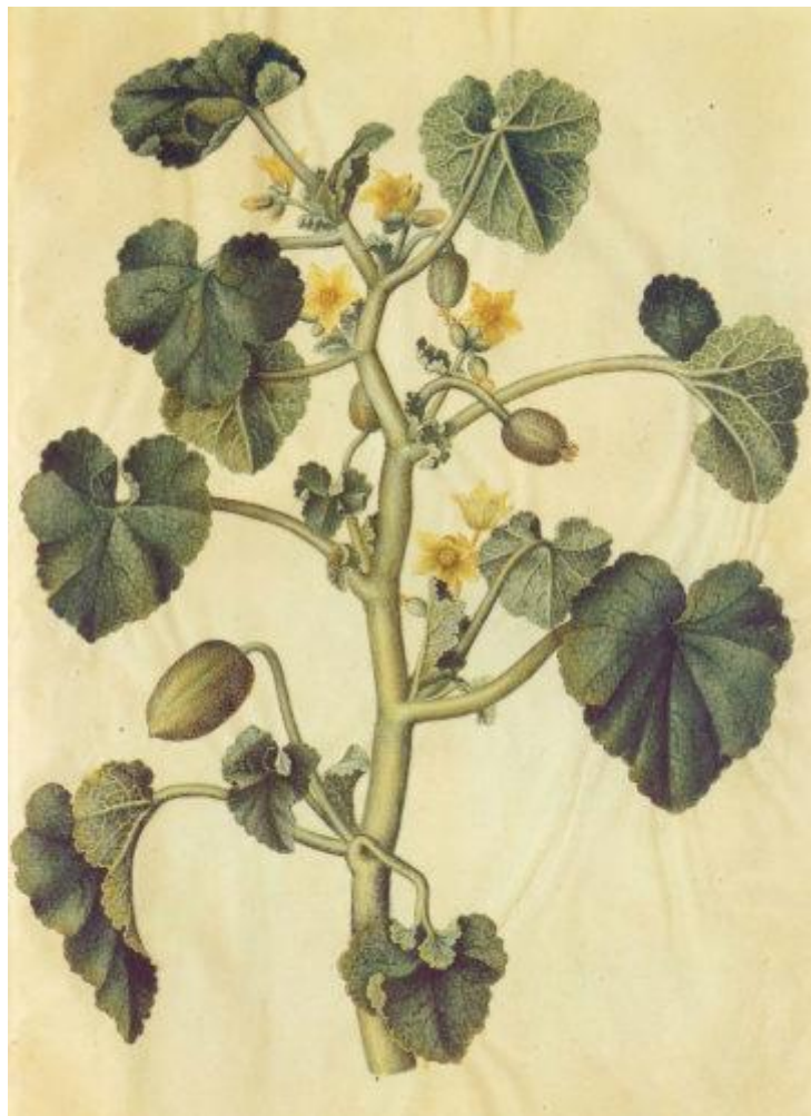
Hans-Simon Holtzbecker, Ecballium elaterium , gouache on vellum, in: Gottorfer Codex , Wikicommons

Tassanee Alleau, Centre d'études supérieures de la Renaissance, UMR-CNRS 7323, Tours Contact : tassanee.alleau@etu.univ-tours.fr