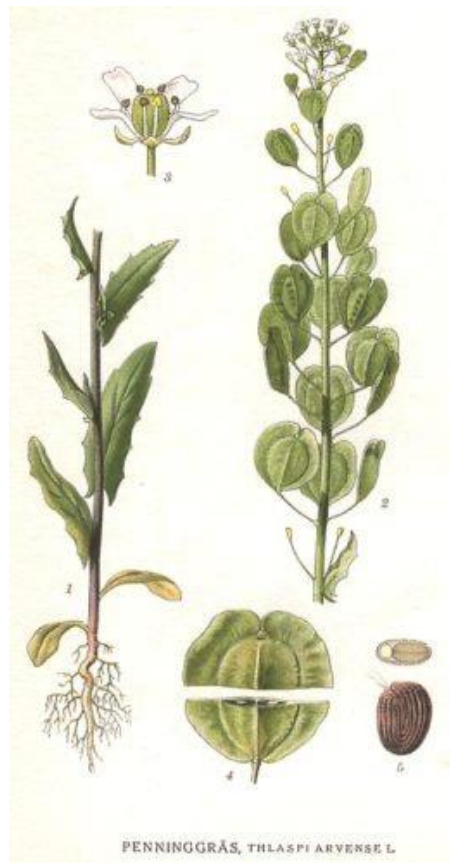
Tabouret des champs ( Thlaspi arvense ), wikipédia

Outre cette dénomination qui pose un problème, l'intérêt est ailleurs : dans la perception du temps court (dans l'urgence de la douleur, 4 heures) ou du temps long pour un remède (si quelques douleurs, moindres, subsistent, 20 jours). Il est précisé la quantité, la dose, la durée de l'application. L'application prend la forme d'un emplâtre. 3