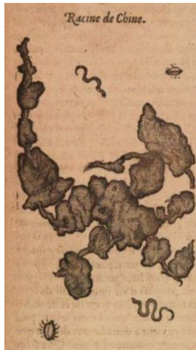
(illustration issue de l' Histoire générale des plantes de J. Daléchamps, 1615)

d'abord décrit par Nicolas Monardes. La Chine c'est pour Jacques Daléchamps citant Monardes :