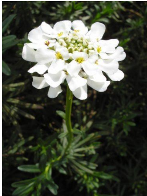
Iberis sempervirens , wikipedia

La racine d'Ibérís d'abord, d'origine méditerranéenne porte un nom qui la confond avec une plante proche, du genre Thlaspi . La première, s'il s'agit de l'Ibérís amère contient une forte teneur en cucurbitacines amères, pouvant s'avérer toxique. La seconde a longtemps été utilisée comme traitement, composant majeur de la thériaque traditionnelle méditerranéenne.