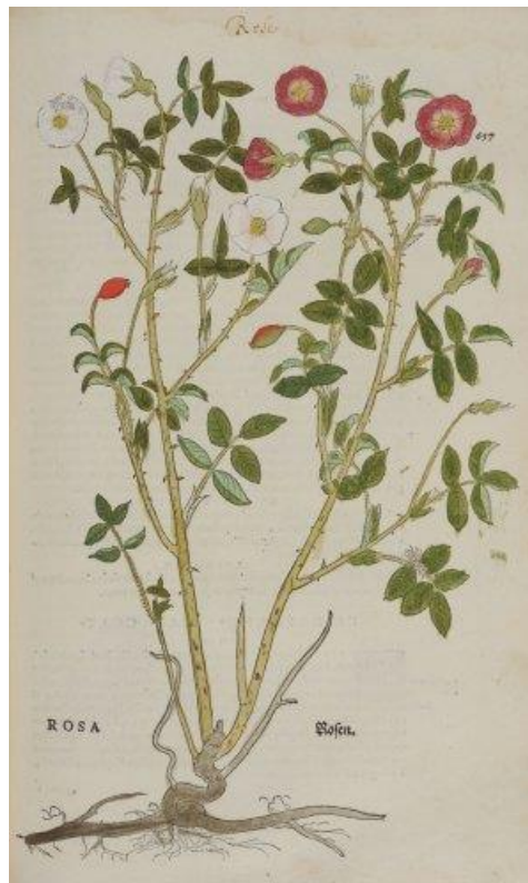
(Illustration de Leonhart Fuchs, Historia Stirpium , 1542, p. 693, © KBR, VH 6393 C http://www.astrolabium.be/erasme/visites/les-plantes/article/rose )