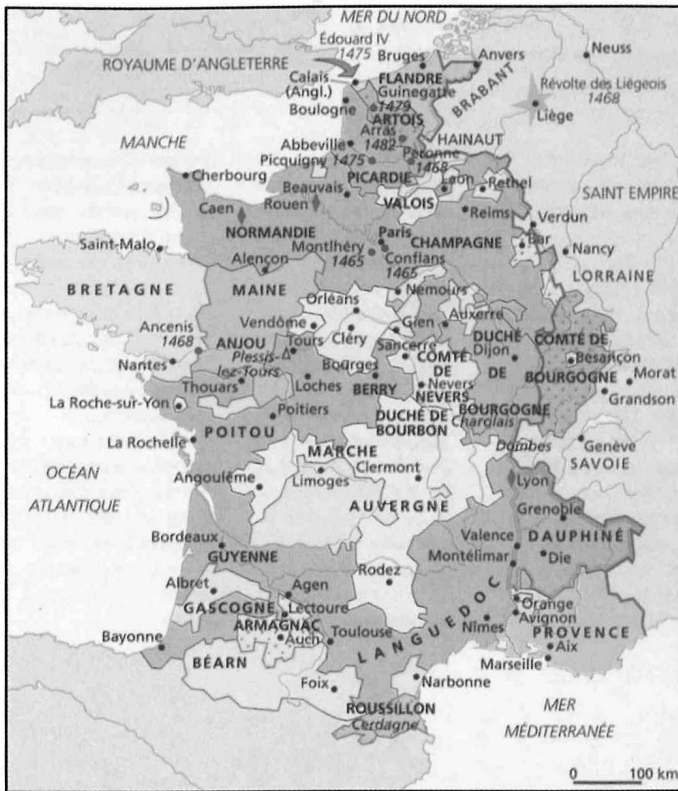
«Les acquisitions de Louis XI»

Duby G. (2000) - Atlas Historique Mondial , Larousse, p. 112.