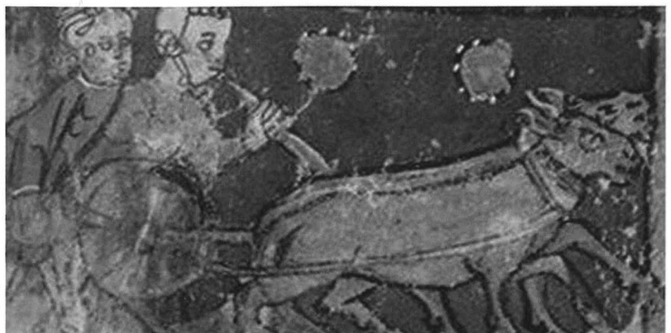
Fonds Bibliothèque Nationale