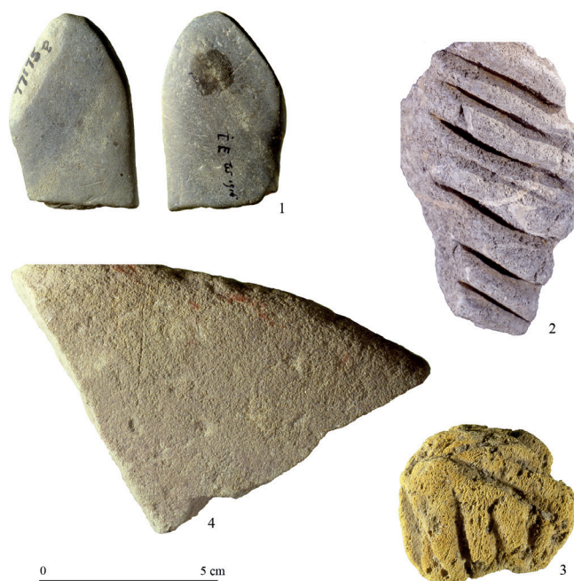
Fig. 5. Outils ayant servi en percussion posée.

Ce sont de petits galets plats, souvent allongés, sur les extrémités desquels l'usage a formé des facettes souvent couvertes de fines stries parallèles (fig. 5, n° 1). Ces outils ont sans doute servi de façon active, tenus dans la main. Contrairement aux autres outils sur galet, ils sont plus abondants dans le Magdalénien que dans le Gravettien.