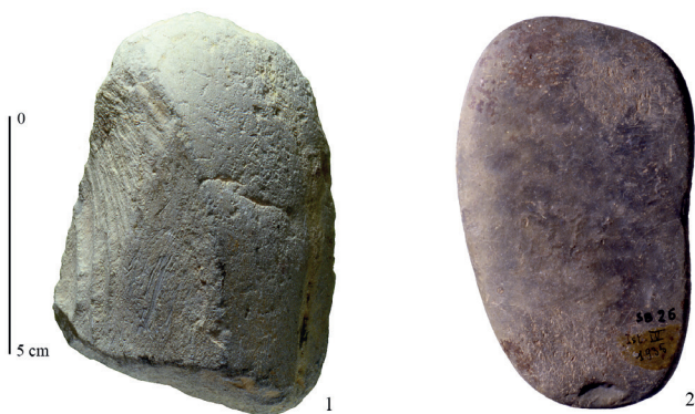
Fig. 1. Outils ayant servi en percussion lancée. 1 : percuteur-broyeur- enclume en phonolite. Aurignacien (Passemard) ; 2 : maillet en marne. Gravettien (Saint-Périer). Musée d'Archéologie Nationale. Clichés S. A. de Beaune.