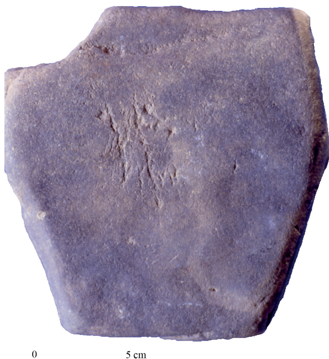
Fig. 2. Enclume en quartzite. Aurignacien (Saint-Périer). Musée d'Archéologie Nationale.

Elles comprennent les galets, blocs ou plaquettes présentant des traces d'impact sur une ou plusieurs faces (fig. 2). Ces traces sont souvent regroupées au centre des faces. Elles sont rarement isolées et sont le plus souvent associées à des traces d'impacts en percuteur, sur extrémités ou flancs. Nous avons regroupé ici avec les enclumes « vraies » les galets à cupule centrale dont on ignore en fait s'il s'agissait réellement d'enclumes. De nombreuses hypothèses ont été formulées à leur sujet (objets actifs ou passifs). Ces traces non élucidées pour l'instant sont comparables à celles présentes sur les galets utilisés par les chimpanzés comme percuteurs pour concasser des noix, mais que certains interprètent comme de possibles enclumes.