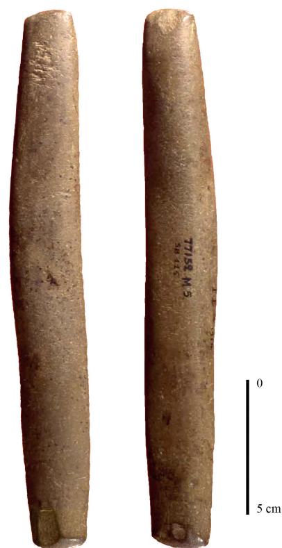
Fig. 3. Pilon-broyeur-mallet en schiste. Négatifs d'enlèvement et poli d'usage aux deux extrémités. Traces d'impacts regroupées sur une des faces. Magdalénien moyen (Passemard). Musée d'Archéologie Nationale.

Un seul outil de ce type issu du Magdalénien moyen (couche E) avait été publié par Passemard comme brunissoir (Passemard 1944, p. 70). C'est un galet fin cylindrique qui mesure près de 20 cm de longueur et dont les extrémités portent des négatifs d'enlèvement et des facettes d'usure polies, voire lustrées (fig. 3). Des