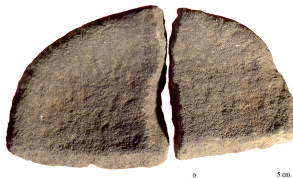
Fig. 6. Lampe en grès gris rougeâtre tendre.

Toutes les matières premières sont locales, provenant pour la plupart des alluvions de l'Arberoue. Les galets ramassés dans le lit de la rivière semblent cependant avoir été choisis selon leur forme, en particulier pour les maillets.