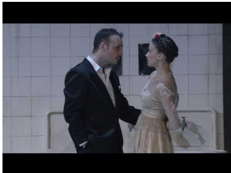
Capture d'écran de « ROMÉO ET JULIETTE – Extrait 1 - La Comédie-Française au cinéma 1 »