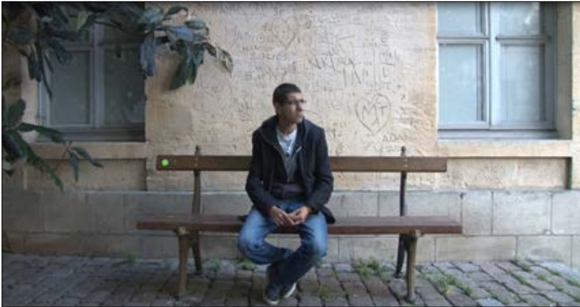
Vidéo 4 – Réticences.

URL : http://data.msha.fr/rfmv/rfmv04/07/4-rticences.mp4