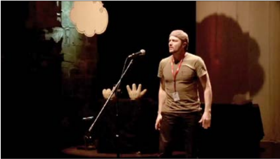
Vidéo 9 – Torsounours, Miroir . Coupe de la Ligue slam de France 2014 (© SlamPoésieBordeaux, 2015). URL : http://data.msha.fr/rfmv/rfmv04/07/9-torsounours-miroir.mp4

sur ce terrain « miné », il a dû prendre parti, se justifier, s'engager et... se mettre en danger (Agiar, 1997). Cette tension entre vue du dedans et vue du dehors est une remise en cause réflexive, une véritable épreuve. Comment, en effet, prendre en compte ses propres conditionnements culturels et leurs déterminismes qui nous animent ? Comment rester distant de soi-même sans être distant de son objet ? Car on ne peut étudier les hommes qu'en communiquant avec eux, en partageant leur existence et donc être soi de la manière la plus authentique possible (Laburthe-Tolra et Warnier, 1993).