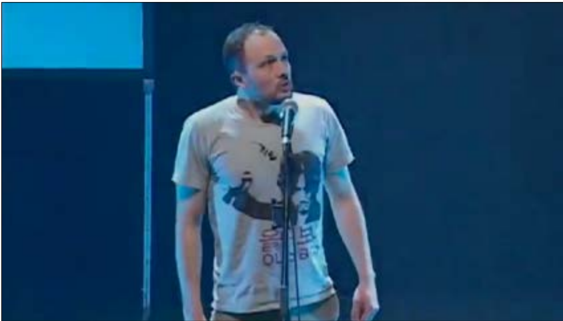
Vidéo 6 – Torsounours, 1 er prix au Championnat francophone de slam 2015 (© Sébastien Jounel, 2015). URL : http://data.msha.fr/rfmv/rfmv04/07/6-torsounours-1er-prix.mp4

Son « palmarès » donne une idée de l'ampleur de sa « conversion » et de son talent :