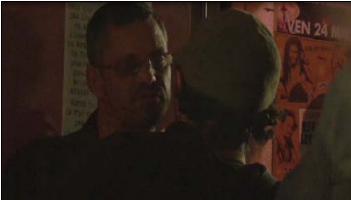
Vidéo 3 – Confessions.

URL : http://data.msha.fr/rfmv/rfmv04/07/3-confessions.mp4