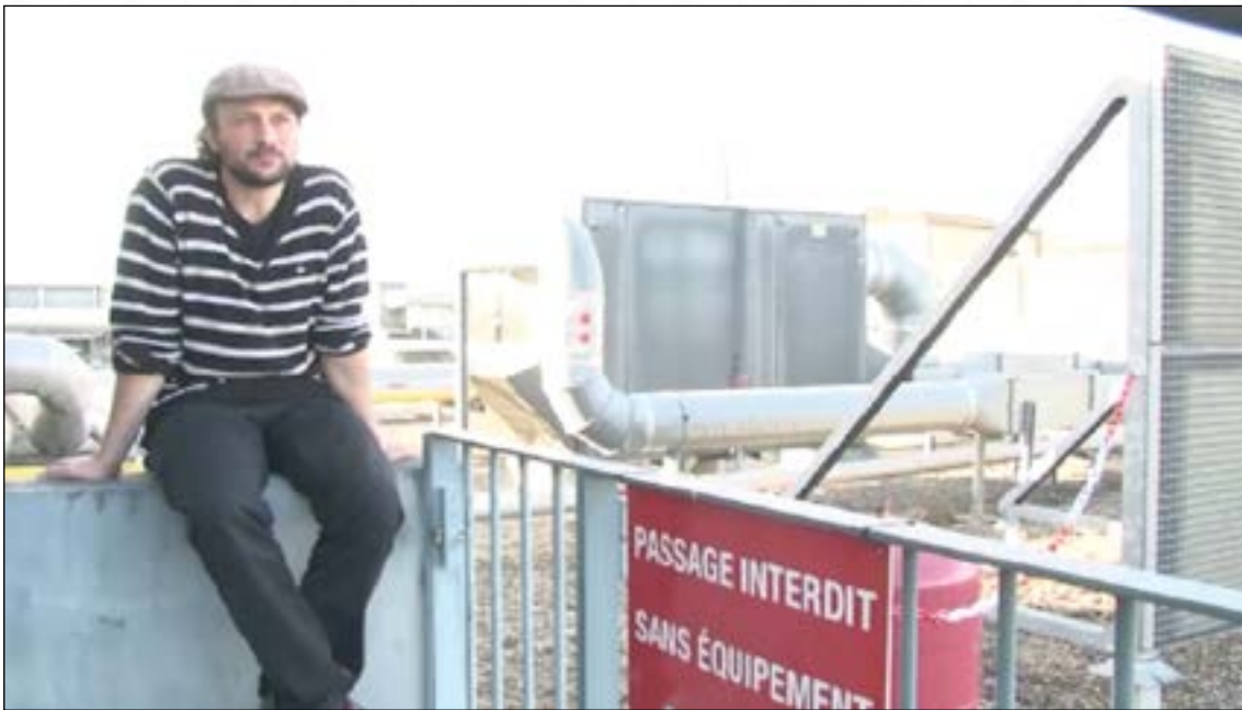
Vidéo 8 – De l'imposture (© Alain Bouldoires et Christine Larrazet, 2015).

URL : http://data.msha.fr/rfmv/rfmv04/07/8-imposture.mp4