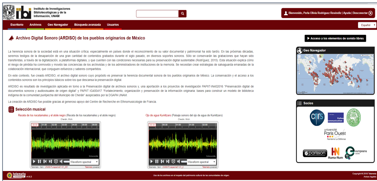
Figure 1. Interface du gestionnaire de contenus, IBII, UNAM, Mexico (page d'accueil)