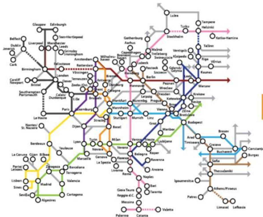
Carte 3. Les 10 corridors de transport du réseau de RTE-T de base – 2012

Pour importantes qu'elles soient, les sommes mobilisées par le budget de l'UE restent secondaires par rapport aux autres types de financement qui impliquent les Etats principaux bailleurs de fonds, la BEI (Banque Européenne d'Investissement) ou les budgets issus de la politique régionale européenne. Enfin, d'autres mécanismes financiers interviennent pour garantir les prêts consentis et attirer les investissements privés dans le cadre du programme Connecting European Facility du plan Juncker (2015-2020).