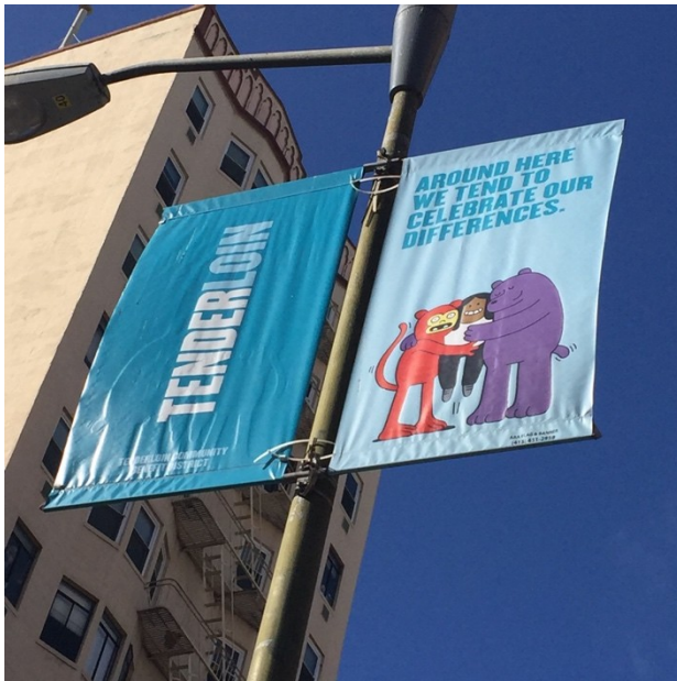
1. Une affiche célébrant la diversité du quartier de Tenderloin