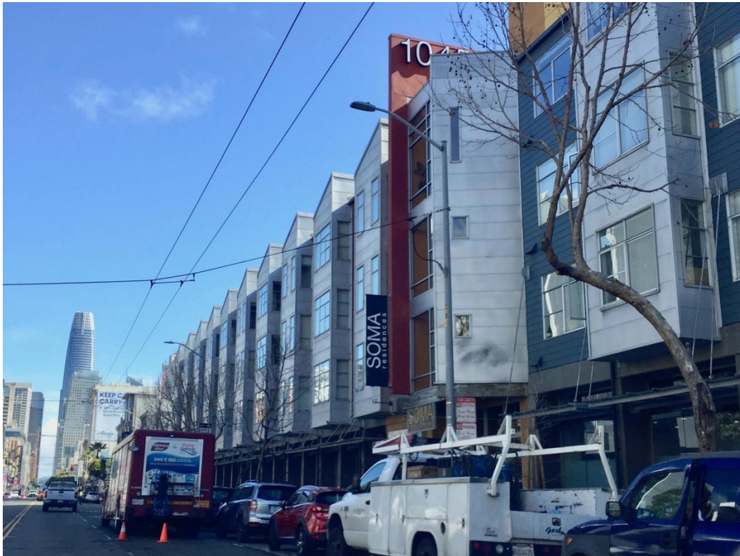
Illustration de couverture : résidences dans le quartier de SoMA, South of Market (C. Ruggeri, 2018)

Pour citer cet article : Ruggeri C., 2018, « Lu / Everybody's favorite city : compte-rendu de Sociologie de San Francisco de Sonia Lehman-Frisch », Urbanités , en ligne .