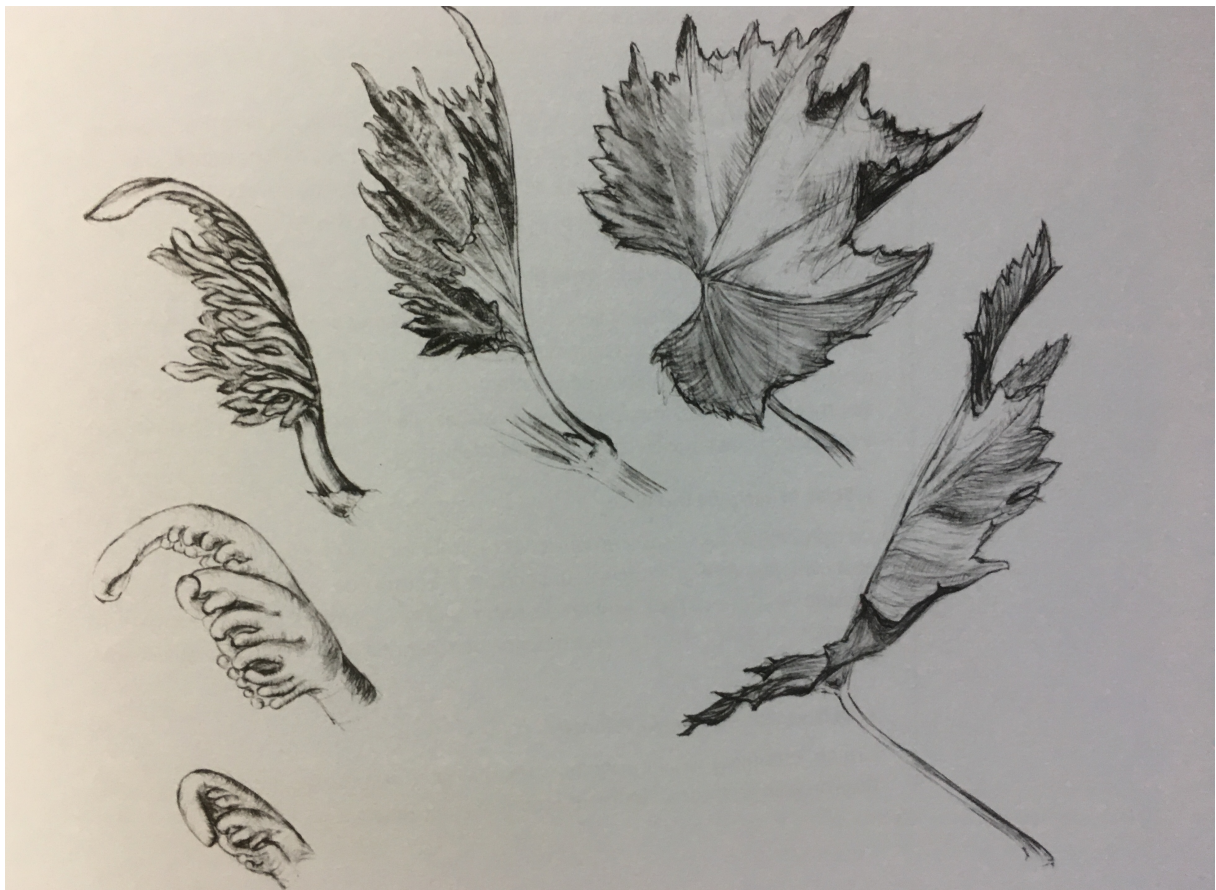
Figure 1 : Le geste de la feuille de vigne (Florin 2017, 21)

L'observation des dynamiques du vivant est même très finement théorisée et mise en pratique dans les différentes techniques dites « goethéennes 5 ». Des formations en biodynamie proposent, ainsi, de stimuler un regard phénoménologique sur le geste de la plante (entendu ici comme une sorte de mouvement évolutif qui donne sa forme à la plante ; voir Figure 1). De ce geste de la plante, peut se déduire son caractère plus ou moins terrestre ou cosmique et sa nature élémentaire, c'est-à-dire son affinité avec les différents éléments (terre, eau, air, feu). La plante n'est ainsi pas perçue comme un organisme figé mais comme un mouvement vivant, l'expression d'une « force de vie ». Par des exercices d'observations prolongées qui peuvent passer par la description systématique de la forme, de la couleur, des sensations ressenties, mais encore par le dessin ou la méditation, il est question d'établir un contact et une sorte d'affinité intuitive et physique avec la plante observée.