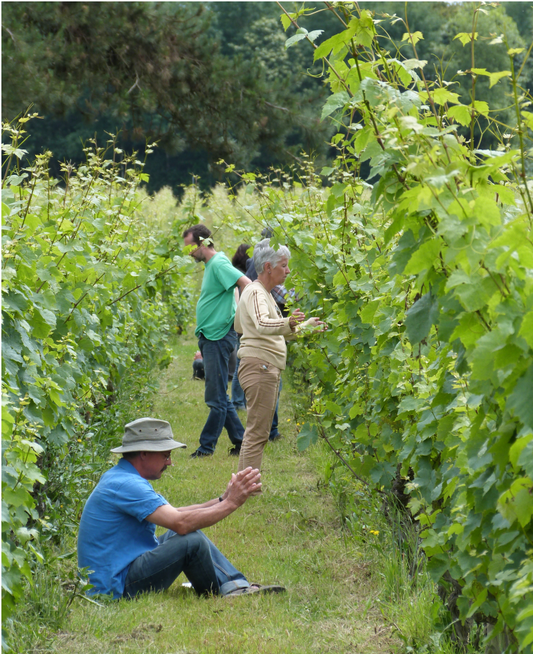
Photo 1 : perception des forces de vie par les participants à la formation de juin 2017, domaine de Bois-Brinçon

L'université d'hiver du Mouvement de l'Agriculture Biodynamique organisée en janvier 2018 sur le thème « Perception du vivant, approche sensible/suprasensible » se sont conclues par des témoignages sur la manière dont ces approches pouvaient servir le travail des agriculteurs. Ainsi, certains biodynamistes disent travailler de plus en plus « en informationnel » ou de manière suprasensible, au sens où, dans la logique de dilutions des éléments matériels que l'on retrouve dans l'homéopathie ou les préparations biodynamiques, il s'agit de se passer de plus en plus des éléments matériels dans les actes agricoles et d'établir un contact plus direct avec les différents éléments naturels. À l'aide de différentes techniques (pendules, baguettes, méditations, visualisations, elixirs, etc.) ou simplement sur la base de