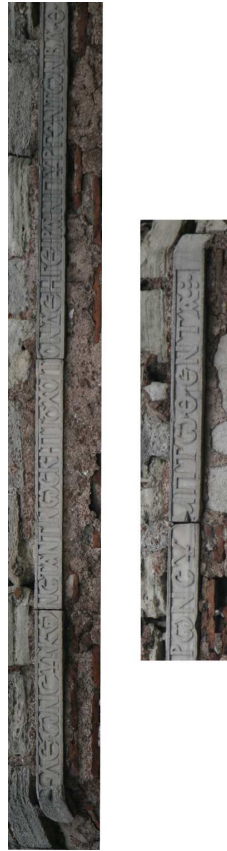
Fig. 4 : Inscription de la tour 37.

il n'est plus possible d'en faire une étude exhaustive. Seule celle de la tour 37, en parfait état, permet de la mener (Fig. 4).