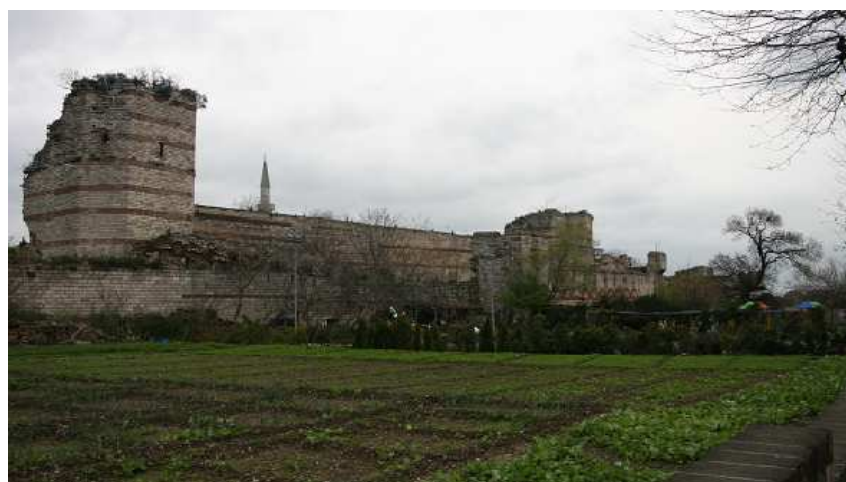
Fig. 2 : Les tours 36 et 37 (premier plan). Porte de Silivri au fond.