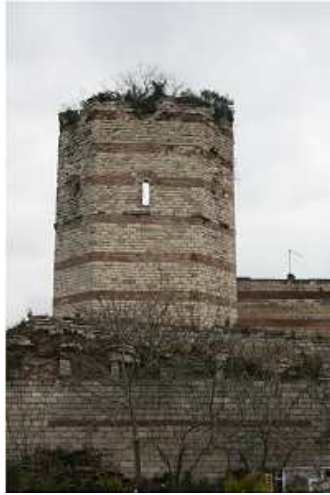
Fig. 3 : La tour 37.

La tour 37 est également une tour hexagonale dont une partie s'est totalement effondrée (Fig. 3). L'inscription est in situ et se présente sur une ligne. Elle est gravée en relief sur cinq blocs de marbre blanc de Proconnèse sur l'une des faces ouest de la tour hexagonale. Le texte est inséré entre deux listels en haut et en bas. Il est également délimité à droite par une croix grecque pattée, au début du texte, et à gauche par une croix composée de cinq points, à la fin. Enfin, ces blocs constituent une corniche insérée entre des lignes de briques, ce qui est caractéristique de l'époque macédonienne. Ce type de maçonnerie peut être comparé aux inscriptions des tours 1 et 4 du rempart, attribuée elles aussi à la fin du X e siècle 7 .