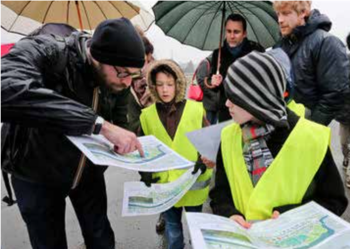
Figure 5 : visites de site, usages de plans et retour des ateliers sur l'espace réel

Les effets que produit le dispositif de RennesCraft tiennent à une forme de détournement du jeu Minecraft. L'ajout d'une règle supplémentaire, celle de la reproduction documentaire du bâti, produit des effets de réflexivité. Les ateliers voient s'installer un double compromis : entre le réel et ce que le jeu, avec son rendu simplifié, permet de reproduire, mais aussi entre le réel à reproduire et l'envie de le faire évoluer. La volonté de reproduire le réel amène à questionner les infrastructures : faut-il ou non représenter les parties techniques de la ville (canalisations, réseaux techniques) pour lesquelles rien n'est prévu dans le jeu ? De plus, la pratique de Minecraft emporte un certain nombre de normes qui entrent en friction avec la dynamique de RennesCraft. Minecraft est un jeu où creuser pour s'abriter et trouver des ressources constituent les bases du gameplay. Ces principes de jeu, issus du mode "survie", étant déjà connus, voir extrêmement bien maîtrisés, par certains participants experts, ces derniers répliquent dans RennesCraft leurs façons de jouer : construire sa cabane, pour s'y nicher. Ainsi, certains joueurs s'aménagent des lieux en dessous du sol, proposant des couches intermédiaires entre le monde du dessus publiquement accessible et les profondeurs de la carte. Lors de l'atelier autour de l'opéra de Rennes, les participants ont creusé pour créer des salles cachées sous le bâtiment, de façon à étendre les espaces disponibles pour la libre invention.