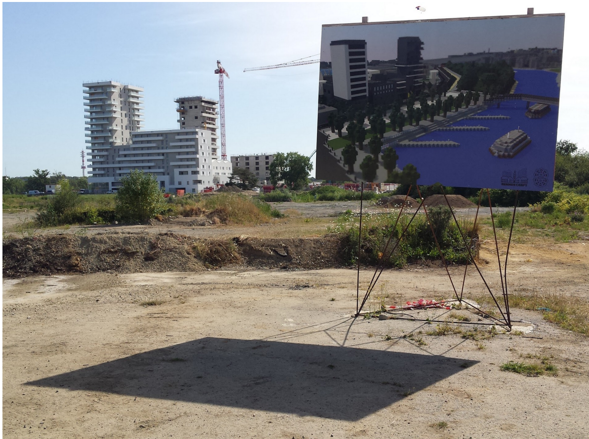
Figure 4 : projection de l'espace recréé dans RennesCraft sur la vue d'architecte des Baud Chardonnet

Enfin, la dernière modalité majeure de l'usage de RennesCraft consiste à laisser libre court à l'imagination, pour transformer l'existant et modifier des éléments dans la ville : "mes idées sont de construire un genre d'immeuble du futur. De belles petites maisons toutes belles", "des jardins au dessus des immeubles, suspendre des fils sur lesquels on pourrait circuler à l'aide de tyroliennes, de la musique ou des peintures pour attirer du monde dans certains endroits reculés"... Tout l'intérêt réside ici dans la régulation et les négociations autour de ce travail de l'imagination. Minecraft est un jeu qui ouvre des possibilités gigantesques, sans intégrer les contraintes urbanistiques. L'atelier conduit à des échanges sur l'apport du "laisser-faire", afin d'initier le dialogue, voire de débattre et de voter pour garder ou non une construction alternative. Par exemple, un bâtiment public destiné à accueillir une bibliothèque (Les Champ Libres) se transforme en gigantesque serre à l'initiative des joueurs. Une piscine est construite en pleine place de la mairie, effacée suite à un vote collectif. Ces exemples nous ont montré la capacité des joueurs à faire muter la proposition de départ d'une logique de reproduction du réel ou de prolongement d'un futur proche, vers des formes imaginées sur l'instant, qui ouvrent une réflexivité sur le bâti et ses contraintes.