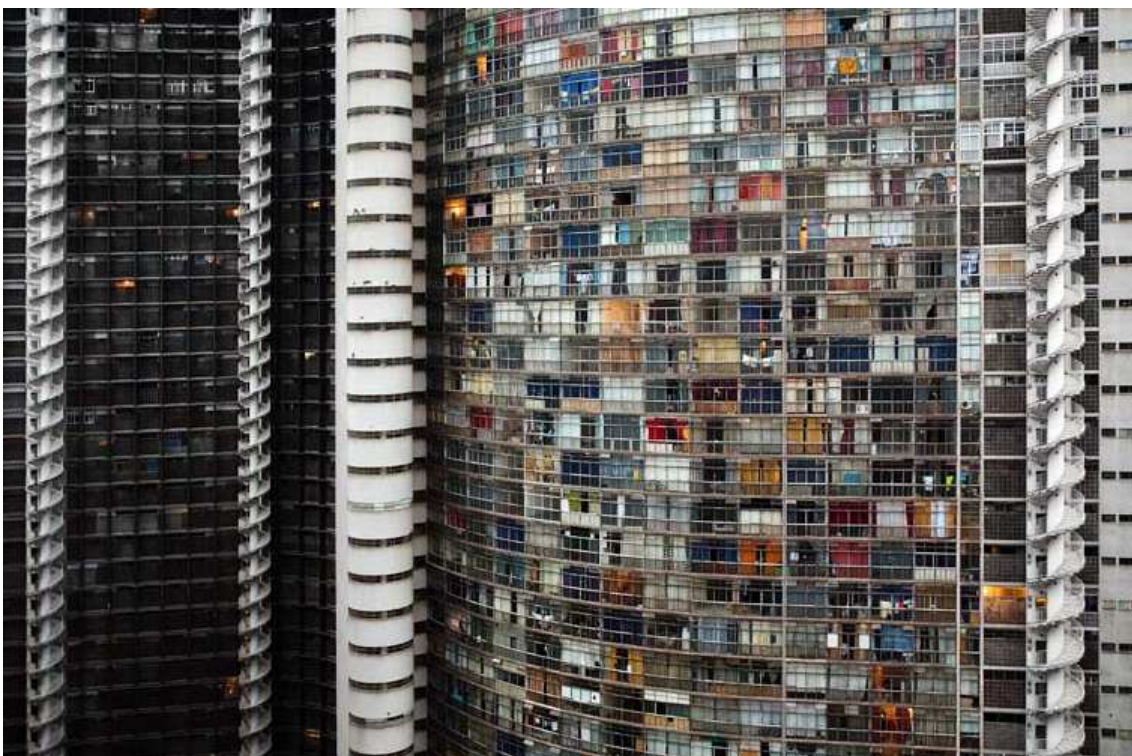
Photo 7 Immeuble du centre de São Paulo