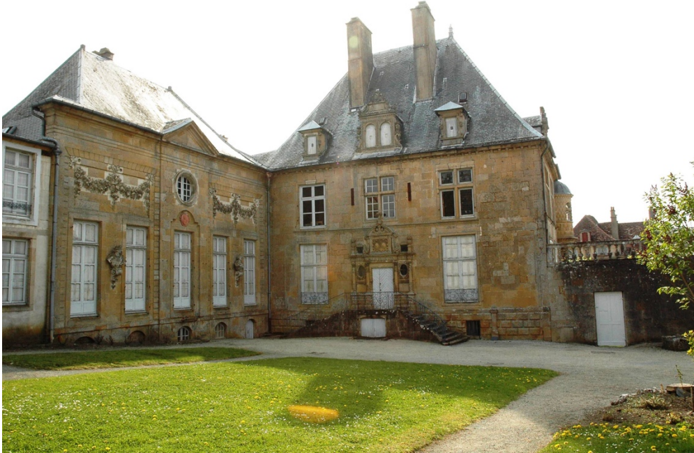
Figure 1. Hôtel du Breuil.

Breuil de Saint-Germain 4 . Cette dernière souhaitait que ce bien de famille serve de lieu de conservation des vestiges archéologiques, résultat des fouilles effectuées dans le sud haut-marnais, ou pour faciliter, au titre des Beaux- Arts, la présentation des tableaux provenant de collections, ou bien encore de pouvoir réaliser l'exposition des savoirs faire patrimoniaux comme la présentation des pièces de coutellerie ou de faïence d'artistes de la région.