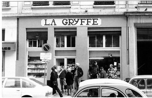
Figure 5. Librairie La Gryffe en 1985.

La librairie La Gryffe a tenu une place importante dans sa vie de militant. Dès 1978, alors qu'elle n'est qu'un embryon de librairie , il s'est efforcé de lui donner les moyens de se développer, « la librairie, c'était d'abord des malles en fer qu'on remplissait de livres : on allait en voiture à Paris chercher des livres à la Vieille Taupe ». Il sait qu'elle est l'indispensable outil du mouvement libertaire et il a voulu qu'elle soit un lieu de mémoire en participant à la création d'une bibliothèque qui permet de consulter les livres épuisés, d'un fonds d'archives et d'un atelier de reliure : « J'ai toujours entretenu un lien étroit avec la librairie. Elle est le prolongement logique de mon engagement. » 111