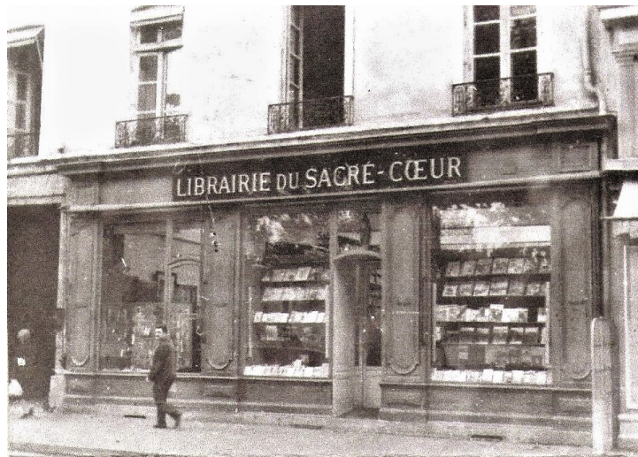
Figure 2. La librairie du Sacré Cœur avant qu'elle ne devienne la Librairie Decitre.