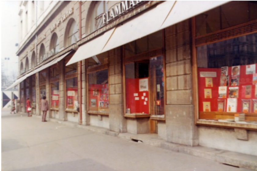
Figure 3. La librairie Flammarion en 1977. Coll. particulière.

vieillot et à ses parquets grinçants : « C'est la fin des allées étroites, des rayonnages démodés ...et des affreuses blouses bleues dont on affuble les vendeuses 36 ».