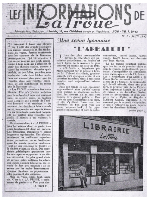
Figure 1. Premier bulletin de la Librairie La Proue .

Dans le Lyon de l'après-guerre dominé par la morosité et l'inquiétude intellectuelle, ces deux librairies vont rajeunir le public du livre et offrir une vitrine stimulante de la modernité. Pour l'ensemble des libraires indépendants, les années 50 sont celles de la reprise économique ; l'inflation ne grève plus leur chiffres d'affaires mais la période se caractérise par une succession de bouleversements qu'ils perçoivent comme autant de dangers : la naissance du livre de poche en 1953 qui fait perdre au livre son caractère d'objet culturel, le développement des clubs et du courtage, la concurrence des nouveaux médias et la multiplication anarchique des points de vente ; ces menaces qui planent sur leur avenir mettent en lumière