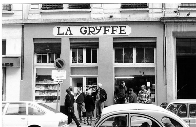
Figure 5. Librairie La Gryffe en 1985.

La librairie La Gryffe a tenu une place importante dans sa vie de militant. Dès 1978, alors qu'elle n'est qu'un embryon de librairie , il s'est efforcé de lui donner les moyens de se développer, « la librairie, c'était d'abord des malles en fer qu'on remplissait de livres : on allait en voiture à Paris chercher des livres à la Vieille Taupe ». Il sait qu'elle est l'indispensable outil du mouvement libertaire et il a voulu qu'elle soit un lieu de mémoire en participant à la création d'une bibliothèque qui permet de consulter les livres épuisés, d'un fonds d'archives et d'un atelier de reliure : « J'ai toujours entretenu un lien étroit avec la librairie. Elle est le prolongement logique de mon engagement. » 111