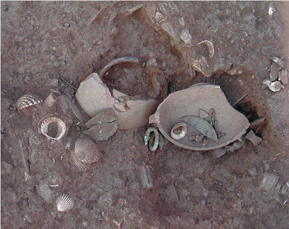
Figure 3 Photographies des offrandes contenues dans des vases, dont certains ont été retrouvés au pied des murs. D'après MAZARAKIS-AINIAN 2005, fig. 5, 18 et 20.

Les offrandes conservées dans l' adyton sont principalement datées entre le VII e et le III e siècles av. J.-C., et remontent ainsi à la première phase du sanctuaire, avant qu'il ne soit partiellement détruit par un tremblement de terre. Elles ont alors été minutieusement récupérées et replacées dans l' oikos sud au début du III e siècle [21]. Le pillage de la première partie du temple empêche une vision claire des choix opérés dans la répartition des anciens ex-voto entre les pièces A et B. En revanche, les fouilles à l'extérieur du temple indiquent qu'une partie de cet ensemble a été déposée dans l'espace Γ, espace long et étroit entre le mur du temple et le mur de péribole à l'est [22] (fig. 2). Le reste a constitué un grand dépôt votif éparpillé sur une zone longue de 8 m et large de 1,60 m, à l'ouest du mur de fortification [23] (fig. 2). L'état de conservation des offrandes découvertes dans l' adyton permet d'émettre l'hypothèse que celui-ci a accueilli les offrandes les mieux conservées et les plus