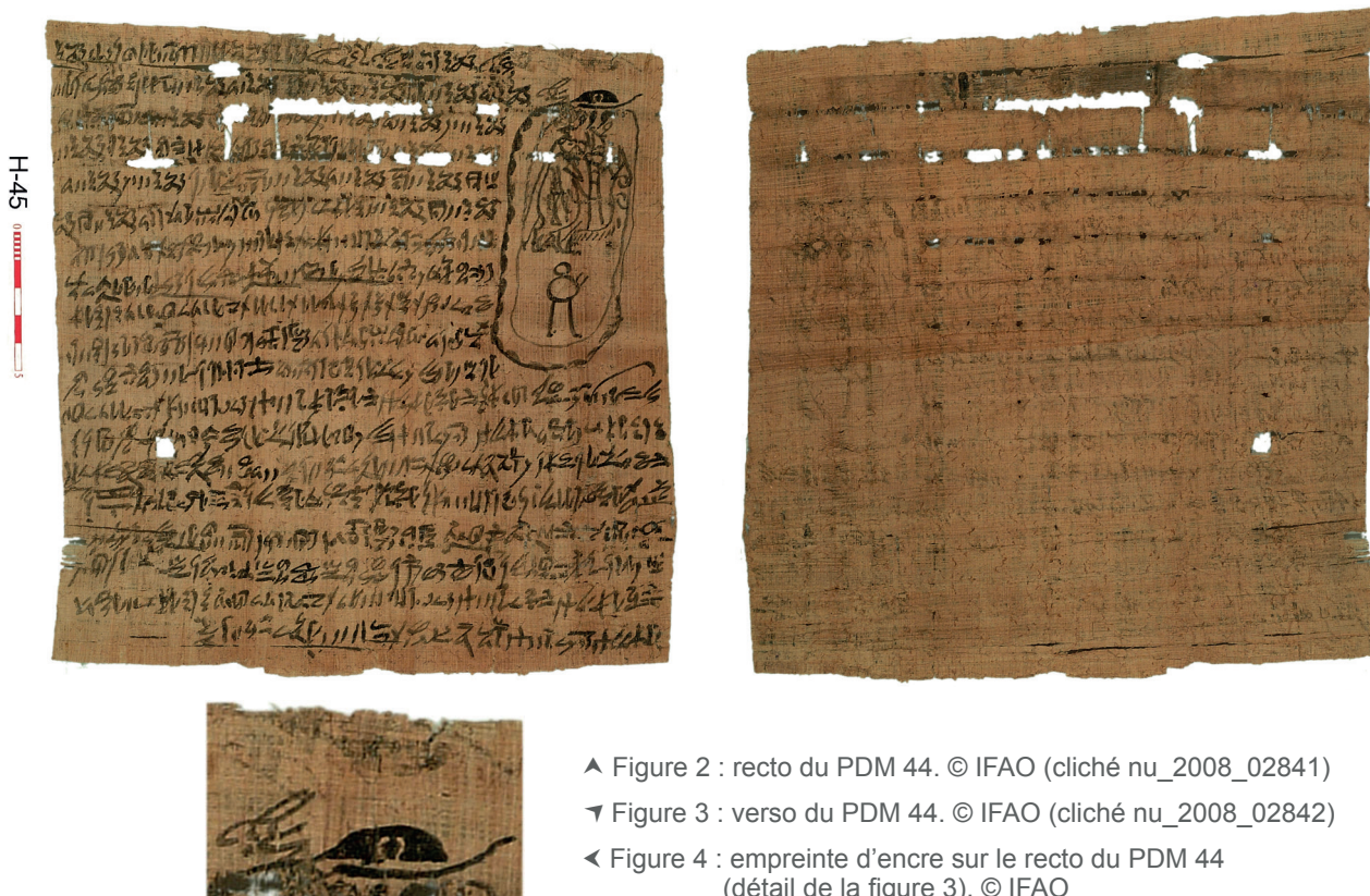
▲ Figure 2 : recto du PDM 44.

La prudence s'impose toutefois dans les conclusions qui peuvent être tirées de l'observation de certaines migrations d'encre, comme l'illustre le cas de l'amulette PDM 44 [63]. Le papyrus (23 cm de hauteur sur 22,8 cm de largeur [64]) a été retrouvé