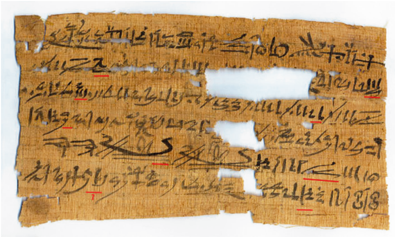
Figure 5 Recto du PDM 36, avec indication des recharges d'encre potentielles.

« Décret royal. C'est le roi de Haute et Basse Égypte Osiris qui dit au vizir et prince Geb : dresse ton mât (2), déploie (?) ta vo[ile], et pars pour les Cha]mps d'Alou, en emmenant l'esprit possesseur nsy mâle et (3) l'esprit possesseur nsy femelle, l'opposant, l'opposante, le mort, la morte qui est face à Anynakht qu'a mis au monde Oubékhet (4), avec l'inflammation séref ( pꜣ srf ), la maladie rémenet ( tꜣ rmn.t ), [et ...] mauvaise et néfaste, après qu'ils viennent contre lui sur (5) une période de trois jours ( hr-tp hrw 3 ). Dire les paroles-divines SUR DEUX BARQUES, DEUX YEUX OUDJAT (6), DEUX SCARABÉES, tracés sur une feuille de papyrus neuve ( dm' n mꜣw ), à placer à son cou. Elle l'écartera (le mal) rapidement. »