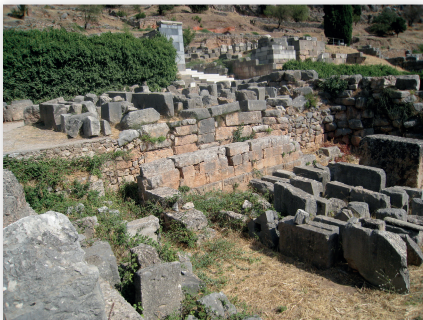
▼ Figure 2 : intérieur de la terrasse au sud du temple : mur nord et retour ouest de SD 310