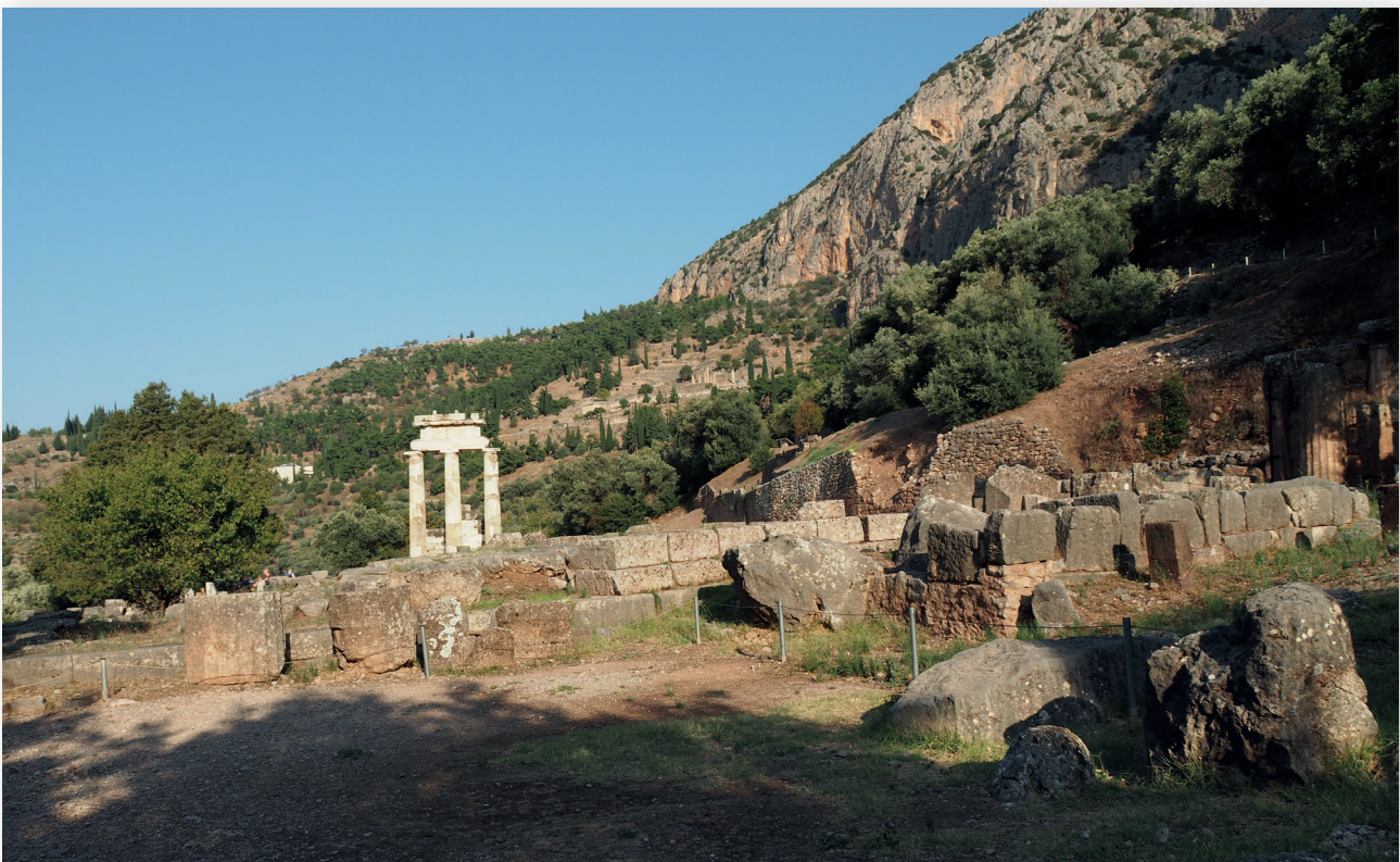
Figure 6 : le sanctuaire d'Apollon vu du temple d'Athéna – cliché A. Jacquemin, 2018.

[70] Le Dionysos de Méthymna en est un bon exemple : Pausanias, X, 19, 3.