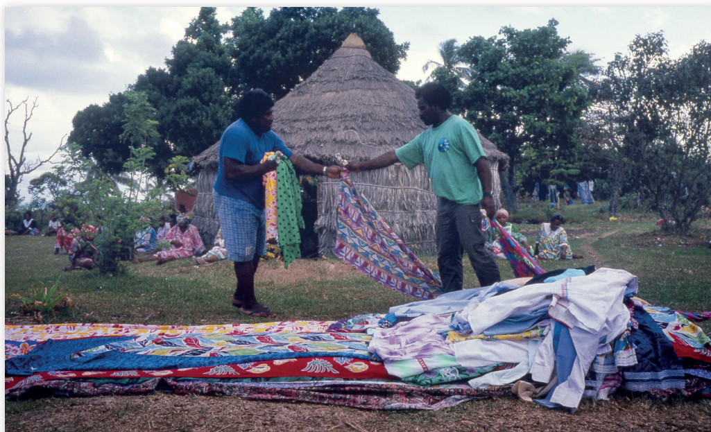
Photo 8 Transfert de prestations pour des funérailles, Yenghebane 1992. La disposition des empilements en ligne des prestations, comme la forme des prestations manuelles (cf. photo 6), soulignent graphiquement leurs rôles de liens entre les deux côtés cérémoniels.

Dans la constitution progressive de chaque côté de la cérémonie focale, les étapes préparatoires de niveaux 1, 2 et 3 rassemblent de façon incrémentale de plus en plus de personnes et d'objets cérémoniels qui seront transférés en grande quantité vers les étapes de niveau 4 et lors de la cérémonie focale.