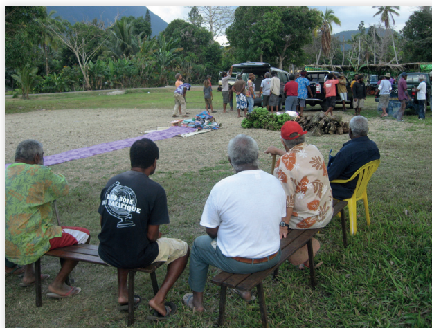
Photo 2 : prestations pour un mariage à Gomen 2010, étape 4. Au premier plan, les représentants des accueillants – le côté cérémoniel de l'époux – attendent qu'une des vagues d'arrivants (au fond) aient fini de décharger et de disposer au sol leurs prestations destinées à circuler vers la cérémonie focale. Ensuite les deux côtés vont effectuer les séquences de transfert et contre-transferts. La cérémonie focale se tiendra le lendemain.

[37] Dans mon modèle, par convention, quatre étapes préparatoires à la cérémonie focale.