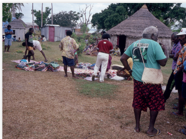
Photo 4 : disposition de prestations pour des funérailles, Yenghebane 1992. Des jeunes gens commencent à disposer des prestations au sol. Pendant ce temps des proches du défunt discutent avec l'orateur, un homme âgé qui porte un tee shirt vert représentant Ataï, héros de la résistance kanak à la colonisation française.

[41] Qui sont des yameevu , phwâmeevu et hulaya aju ; MONNERIE 2012b.