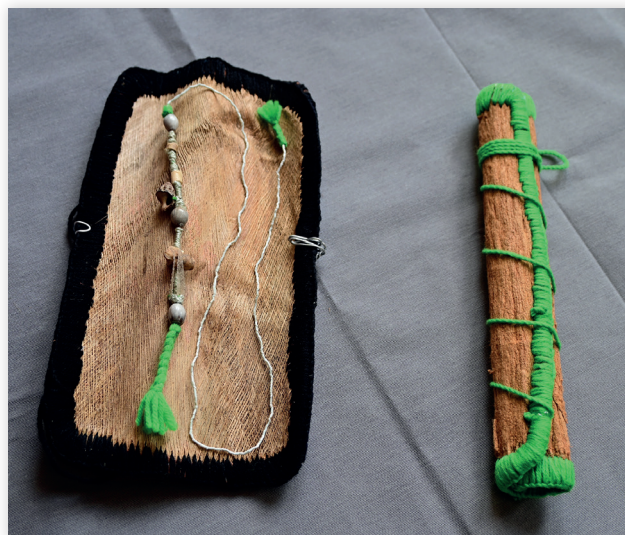
Photo 7 : deux monnaies kanak de fabrication contemporaine (région de Hienghène), une ouverte, l'autre fermée.

L'usage du terme monnaie kanak sera conservé ici. Cependant « objet valorisé » – en anglais valuable – en serait une caractérisation plus pertinente, ayant pour effet de ne sous-entendre ni une dimension d'équivalent universel, ni une différence majeure, une incommensurabilité, avec les autres objets des circulations cérémonielles. Au nord de Hoot ma Whaap, les monnaies kanak les plus utilisées sont nommées hâjet [52]. Elles sont constituées d'une enveloppe végétale et/ou de tissu épais de forme rectangulaire qui est roulée, maintenue par un cordon, contenant une longueur d'une très fine cordelette sur laquelle sont enfilés de minces perles et d'autres éléments, dont de minuscules coquillages et sculptures (photo 7). Dans les séquences d'élaboration, quand elle est présentée, manipulée et transférée, la monnaie kanak est