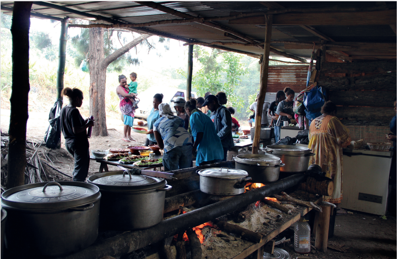
Photo 10 : cuisine dans une cérémonie focale de mariage, Tiari 2012. Au premier plan les grosses marmites en fonte d'aluminium disposées sur deux rails, chacune avec des mets différents, cuisent au feu de bois. Au fond, des femmes et quelques hommes mettent la dernière main aux entrées.

ils se complètent et se valident dans la préparation, la commensalité, le partage, l'ingestion de nourriture ( photo 11 ). Ces repas visent à la satiété des participants, dimension de fortification immédiatement perceptible de l'intensification de la vie, à la fois personnelle et collective qui résulte de l'ensemble du travail cérémoniel.