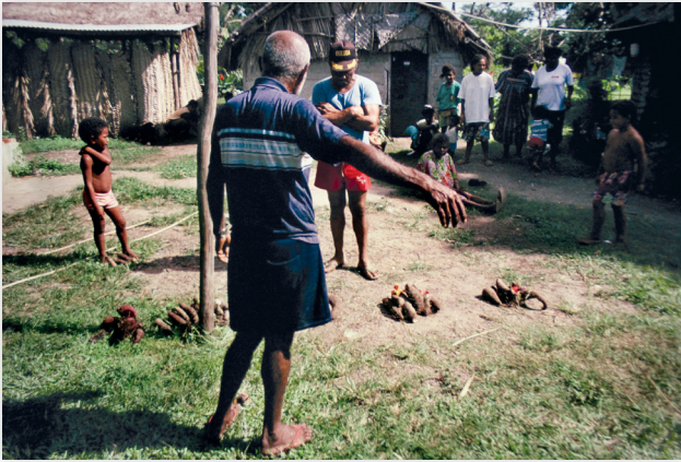
Photo 5 : cérémonie de prémices des ignames, Arama 1993. L'orateur des accueillants (de dos) fait un discours sur les tas d'ignames (associés à des fleurs d'hibiscus).