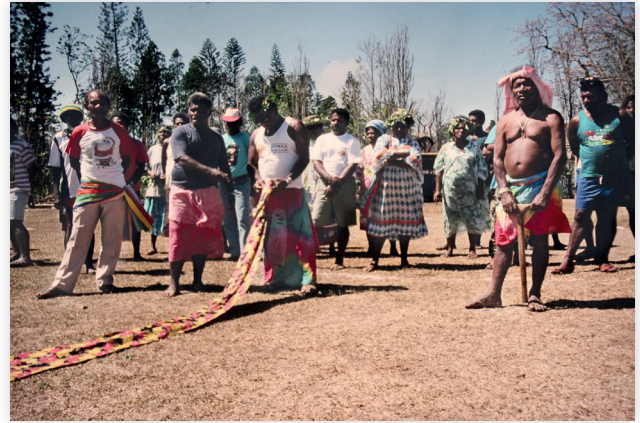
Photo 6 : grande cérémonie régionale d'arrivée et d'accueil, Bondé 1993. Le côté des accueillants : au centre, un dignitaire tient à la main une prestation d'étoffe qui lie les deux côtés cérémoniels, pendant que, sur la gauche, un autre dignitaire prononce un discours.

focales concernées par ces mariages ou funérailles sont de statut important et, pour les funérailles, plus leur trajectoire d'existence est complète, plus les ensembles cérémoniels sont importants [44].