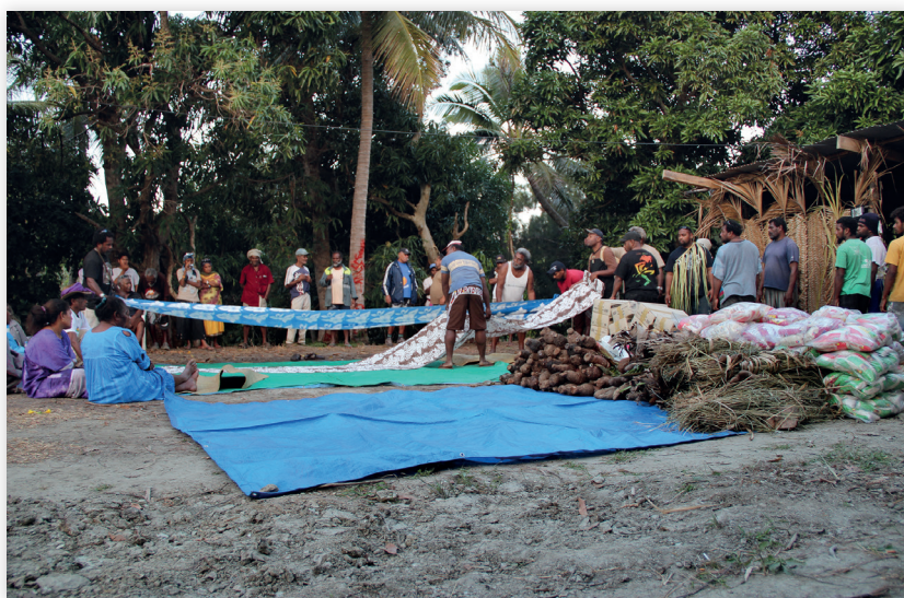
Photo 3 : prestations dans une cérémonie focale de mariage, Tiari 2012. À droite, les représentants du côté cérémoniel de l'époux sont en train de disposer leurs prestations au sol, réparties en deux lignes (nourritures et autres objets cérémoniels) destinées au côté cérémoniel de l'épouse. À gauche, celle-ci, avec des proches, est assise au bout des lignes de prestations, face au côté de l'époux.

Le côté maternel de l'ensemble cérémoniel est désigné dans la langue d'Arama comme « ceux qui prennent » ( ajalu ) car au plan quantitatif, dans la cérémonie focale, ils reçoivent en prestations transférées par le côté paternel trois fois la quantité d'objets cérémoniels qu'ils leur transfèrent. Cette asymétrie des flux de circulations caractérise les cérémonies du cycle de vie [42]. Elle est associée à la relation nommée nhoor relative aux apports respectifs de sang et de vie attribués à la mère et aux parents maternels [43]. De façon générale, plus les personnes