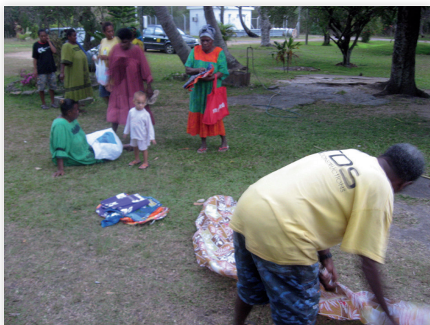
Photo 1 : prestations pour un mariage à Gomen 2010, étape 1. Pour un petit collectif d'arrivants, un homme dispose au sol des prestations destinées à circuler vers la cérémonie focale.

Dans les cérémonies complexes, le principe dyadique s'exprime de façon quasi fractale en ce qu'il organise (i) globalement l'ensemble cérémoniel, qui est constitué de deux sous-ensembles, (ii) eux-mêmes composés d'étapes cérémonielles de forme dyadiques, (iii) préparatoires à la cérémonie focale, elle aussi dyadique (fig. 2). Les étapes cérémonielles constituant les deux sous-ensembles qui préparent la cérémonie focale ont toutes une forme générale proche de la configuration cérémonielle simple. Mais leur ampleur est de plus en plus grande au fur et à mesure qu'elles se rapprochent de la cérémonie focale. À terme, ces deux sous-ensembles vont constituer les deux côtés qui se feront face dans la dyade de la cérémonie focale.