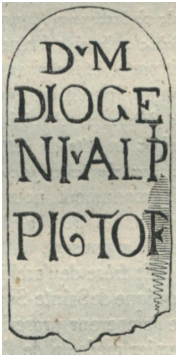
Figure 5 Relevé de la stèle par Jules Chevrier, envoyé à Antoine-Jean Letronne par l'intermédiaire de Paul Compin (Extrait de LETRONNE 1847, p. 513).

J. Chevrier signale ainsi la mauvaise lecture du fac-similé, du fait d'un nettoyage plus minutieux de la stèle par ses soins révélant un B au lieu d'un P et corrigeant par conséquent Alpi en Albi [38]. La lettre cependant fut l'occasion pour Chevrier de signaler, à demi-mot, le manque de rigueur de la part de Letronne à plusieurs niveaux : l'érudit local rappelle tout d'abord que c'est lui l'inventeur de l'inscription, et que par conséquent son nom aurait dû être signalé dans l'article, comme « part qui [lui] revient [39] », ce à quoi le savant parisien ajoute en note de manière assez ironique : « J'aurais accordé, de grand cœur, cette part à M. Chevrier, si la lettre de M. Compin eût fait mention de lui. Il est de toute justice que le zèle des archéologues reçoive de nous la seule récompense qu'il soit en notre pouvoir de leur donner, la mention publique de leurs découvertes et de notre reconnaissance [40] ».