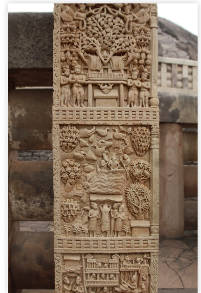
Figure 1 : Porte est du stūpa de Sāñcī. La marche sur les eaux du Buddha (1 er s. av. J.-C.)

hutte, à empêcher ses disciples de couper du bois avec des haches et ainsi d'allumer un feu sacrificiel, à marcher sur les eaux lors d'une vaste inondation, puis à s'élever dans les airs avant de confondre le vieil ascète au sujet de sa prétention à se considérer lui-même parfaitement accompli (arhant) dans le domaine de l'ascétisme et de la délivrance du cycle des transmigrations. Tous ces prodiges s'imposèrent à Kāśyapa tout autant qu'à ses cinq cents disciples, et tous finirent par se convertir à la doctrine du Buddha.