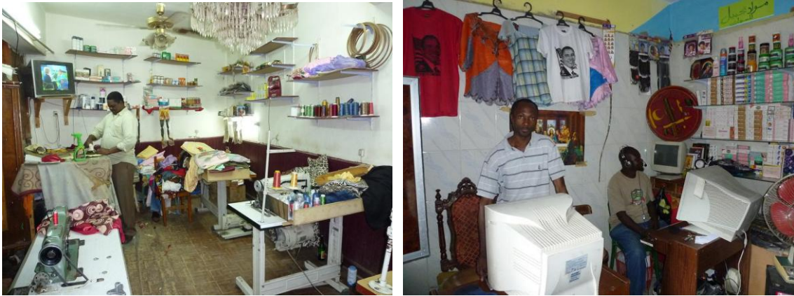
Photos 5 et 6. Boutiques soudanaises (Hadayek el Maadi)