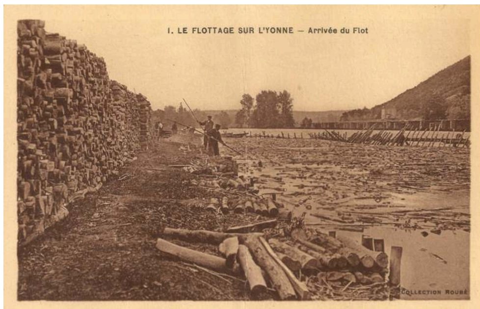
Figure 2. Flottage « à bûches perdues » du bois pour Paris aux abords de Clamecy vers 1900