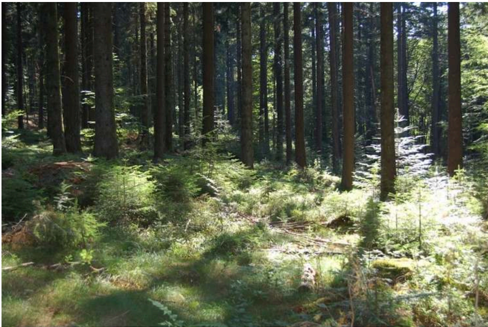
Dispositif Association Futaie irrégulière n° 16.