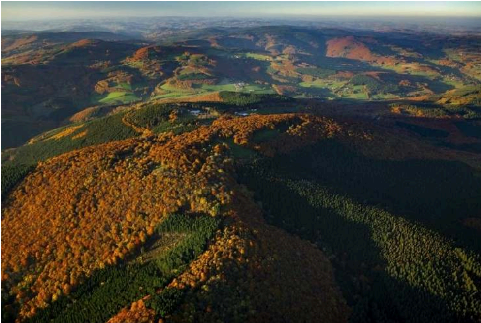
Figure 3. Mosaïque paysagère depuis une vue aérienne du mont Beuvray

Site de l'ancienne capitale gauloise de Bibracte.