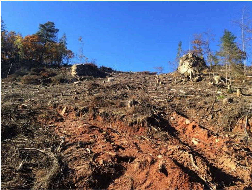
Figure 4. Coupe rase en versant