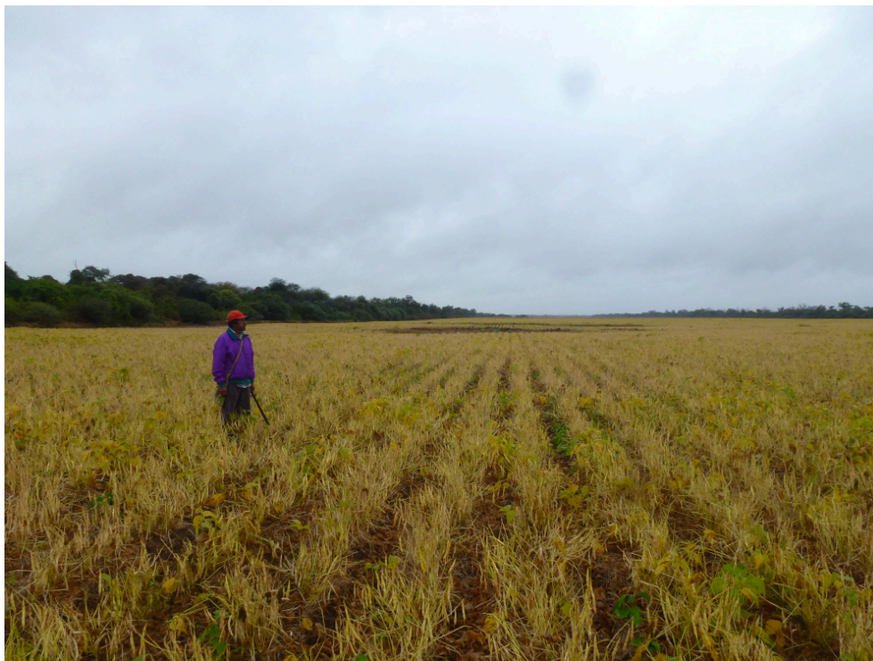
Photo 1. L'avancée du soja sur les territoires des Wichis