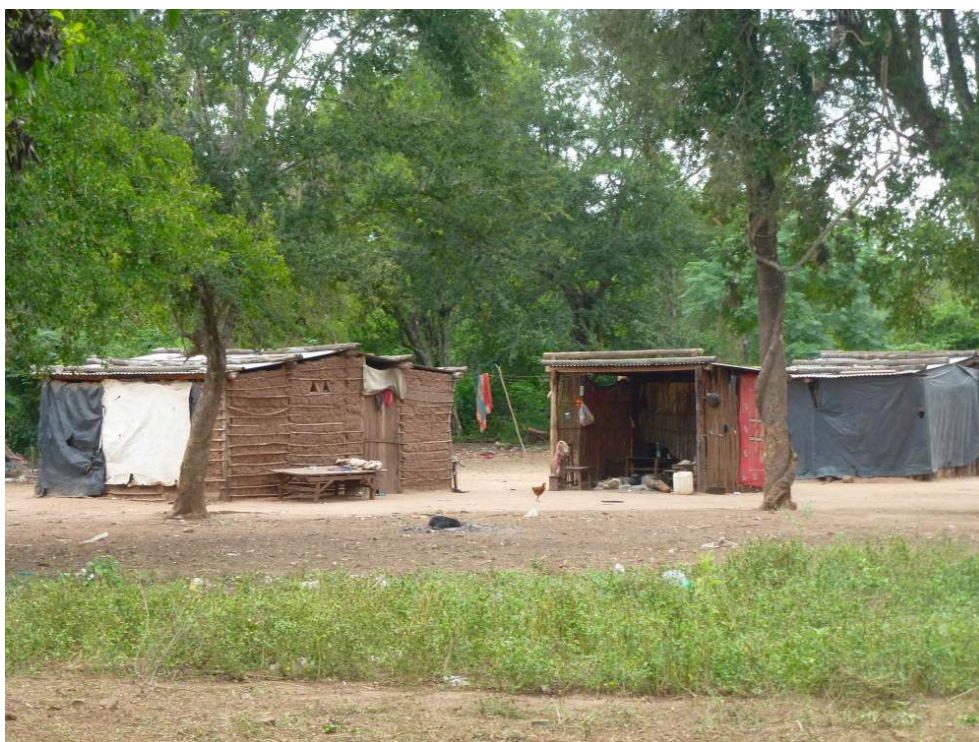
Photo 2. Habitat précaire dans les faubourgs de Tartagal