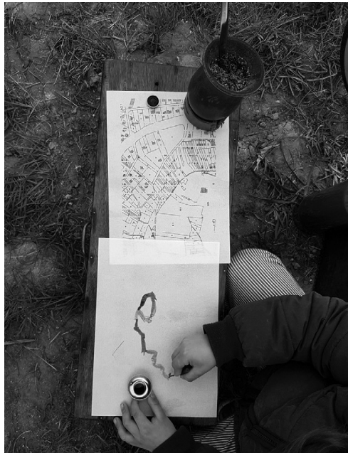
FIGURA 2. Calcando el catastro sobre papel comestible con tintas para repostería.

1. Comer el catastro. Se trata de la más famosa de las prácticas de desmesura, por su fácil implementación y fuerte simbolismo (figuras 2 a 4). Es necesario equiparse con papel comestible (del que se usa para decorar postres, o para hacer ostias), de una pluma de acero para escribir, y de tintas también comestibles de las que se usan para teñir tortas. Bastará con copiar sobre el papel comestible una porción de catastro, local o lejano, dejar secar el conjunto sobre una cuerda para ropa, antes de comerlo.