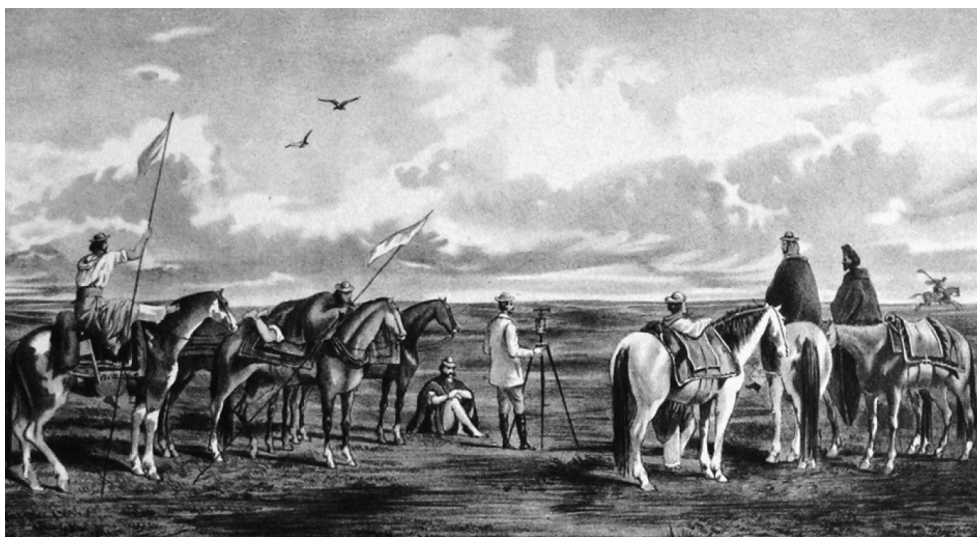
FIGURA 1. Agrimensores en la Pampa, siglo XIX. Autor: J. L.Pallière, en Escenas Americanas. Reproducción de cuadros, aquarelas y bosquejos . Litografía Pelvilain, 1864.

A más de 12.000 kilómetros del Río de la Plata, y con aires mucho menos austeros que los que adoptaban los agrimensores del siglo XIX, ¿qué hacen, en definitiva, estas personas desperdigadas por un descampado a poca distancia de la capital francesa (cf. fig. 1)? Se juntan con el simple propósito de «aliviar» la superficie terrestre de tantos mapas que la midieron, calcular sus formas y sus curvas, establecieron distancias entre sus puntos, delinearon fronteras, demarcaron apropiaciones. Para eso, como quien desanda caminos, hay que realizar el acto contrario al de cartografiar, o sea des-cartografiar. Para darse objetivos más humildes que el de dar por tierra con cuanto mapa se hizo desde los albores de la cartografía, decidieron ensañarse con el catastro de tierras, en Francia