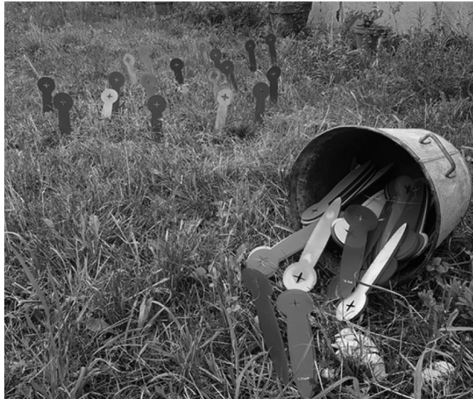
FIGURA 8. Mojones de mensura se transforman en campo de flores.

5. Teodolito-bar . La última herramienta inventada para la desmensura es una copia fiel del ancestro del teodolito, llamado popularmente en el Río de la Plata «plancheta». Usada hasta la década del 50 en Argentina y Uruguay para medir fácilmente grandes campos, la plancheta está formada por un trípode al cual se le superpone una tabla de pequeñas dimensiones donde se dibuja en el campo el mapa de la propiedad. Esta tabla tiene que estar permanentemente en posición horizontal. Se ideó para el teodolito-bar un sistema de medición de esta horizontalidad en base a un pequeño recipiente, el cual tiene que estar relleno con vino. Para ello, el instrumento posee en su caja tres botellas de vino, que se van usando para calibrar el teodolito durante toda la operación cartográfica (figura 9).