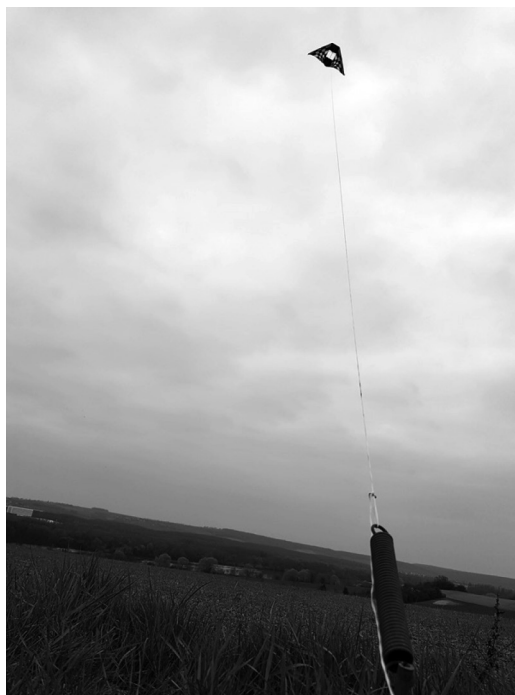
FIGURA 5. Atado a un mojón en un día ventoso, esta cometa permite aliviar el peso del catastro sobre la Tierra.

3. Mediciones suaves e imprecisas. De forma algo más sutil que los dos métodos anteriores, éste no propone una simple desconstrucción (simbólica) del catastro, sino una subversión de la lógica de precisión que constituye su legitimidad histórica. Para ello, basta con utilizar los instrumentos del agrimensor, pero asegurándose de que midan mal. Por ejemplo, usamos una legítima cadena de topógrafo de 10 metros usada para calcular distancias en el terreno, pero cambiando uno de sus eslabones de metal por una tira de goma (figura 6). De esta forma la cadena se estira aleatoriamente y nos aseguramos de que el resultado sea falso en referencia a las normas geométricas convencionales. Entre otras mediciones suaves e imprecisas solemos usar el teodolito (la herramienta fundamental de los que hacen mapas), pero acostados en el suelo, con colchón y almohada. Esta