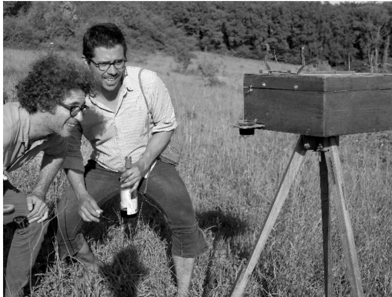
FIGURA 9. Evaluación de la horizontalidad del teodolito-bar.

Información adicional. Para mayor esclarecimientos sobre la «desmensura» del mundo, se recomienda consultar el siguiente sitio web, < https://www.instagram.com/desarcentage/ > (con el aplicativo Instagram, buscar <@desarpentage>). Para participar en las futuras sesiones de desmensura, proponer nuevas técnicas, etc, contactarse con el autor de esta nota.